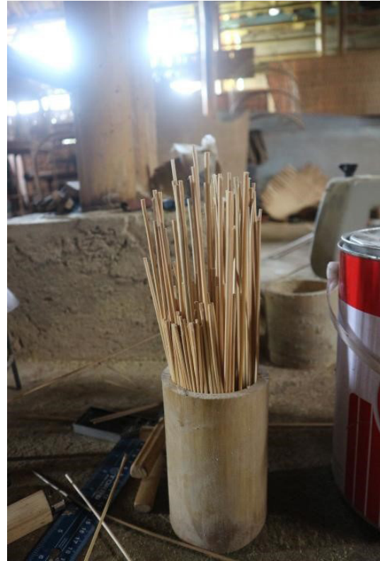
Gambar 4. Bahan untuk membuat Ruji

perakitan keseluruhan bagian-bagiannya hingga menjadi hiasan tutup lampu dengan teknik dan bahan yang dipakai dalam membuat sangkar burung.