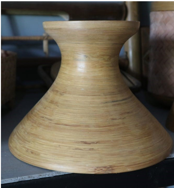
Gambar 3. Hasil kerajinan yang terpengaruh dari luar

Hal ini menjadikan faktor penting yang dilihat oleh industri kerajinan yang memiliki perkembangan dalam membuat sebuah industri kerajinan semakin memberikan inovasi dan kemajuan, perkembangan dari segi industri dipengaruhi oleh beberapa faktor seperti: tersedianya bahan baku, bahan bakar, pasar dan sarana penunjang, tenaga kerja yang terampil, jaringan yang baik dan lingkungan yang mendukung dari hasil produksi tersebut (Menurut Sandi (dalam (Rachmanto, Ellyas Arini Wanda, Winny Astuti, 2020))). Sebuah kerajinan yang dapat dikembangkan terlihat dari banyak faktor pendukung pada sebuah kelompok masyarakat yang berusaha untuk membuat perubahannya.