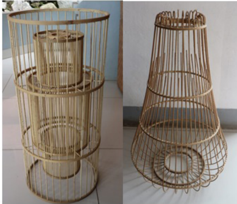
Gambar 2. Kerajinan Hiasan Tutup Lampu dengan Teknik dan Bentuk dasar Sangkar Burung

Dengan kata lain bentuk awal sebuah objek akan tetap sama, meskipun ukuran serta ada beberapa bagian tertentu yang dihilangkan dan diubah, contohnya pada