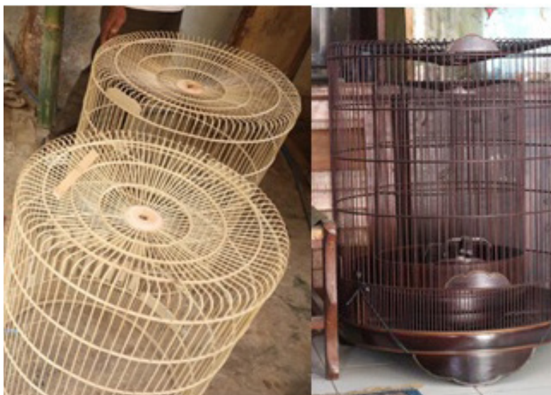
Gambar 1. Kerajinan Sangkar Burung Selaawi

bentuk dasar sangkar burung yang diubah menjadi ukuran yang kecil, meskipun pada dasarnya sangkar burung biasanya memiliki pintu dan kepala kaitan, tetapi akan tetap disebut sangkar burung meskipun bagian pintu dan kepala kaitannya itu dihilangkan, tetapi akan berbeda namanya ketika bentuk dasar dan teknik yang digunakan telah berubah.