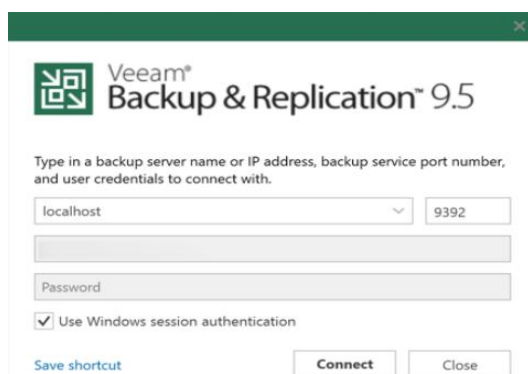
Gambar 2. Login masuk ke Veeam Backup

Proses untuk akses ke veeam Backup bisa menggunakan remote desktop protocol yaitu dengan mengakses desktop dari jarak jauh dan tanpa masuk langsung ke server tersebut. Secara umum untuk proses Backup harus ditentukan, misalnya menggunakan Backup incremental forever . Incremental forever Backup sering digunakan oleh sistem Backup dengan disk-ke-disk-ke-tape. Gagasan dasarnya adalah bahwa, seperti cadangan tambahan, cadangan tambahan selamanya dimulai dengan mengambil cadangan penuh dari kumpulan data. Setelah itu, hanya pencadangan inkremental yang dilakukan.