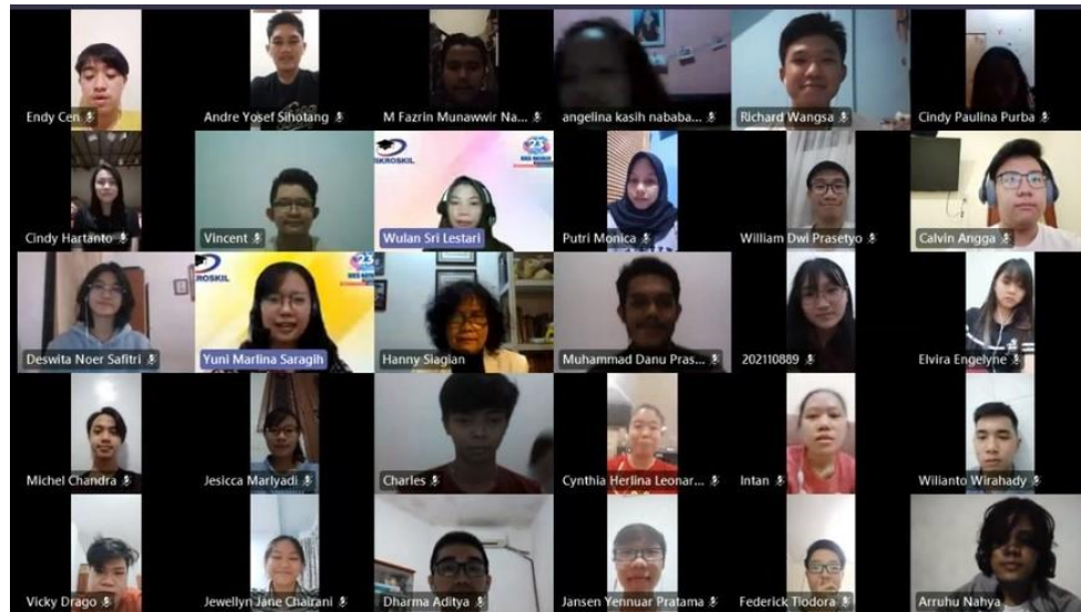
Gambar 2. Pelatihan hari pertama