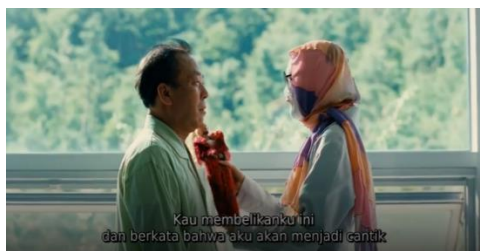
Gambar 7. membayangkan masa depan

Hanna/Jenny: “Kau membelikanku ini dan berkata bahwa aku akan menjadi cantik...” (Sebelum melepas perban operasi plastiknya Hanna/Jenny mengunjungi sambil berbicara pada ayahnya dan membawa boneka Barbie, Hanna/Jenny membayangkan berbagai kemungkinan tentang masa depannya bahwa dengan kecantikan ia bisa berubah, diterima oleh orang lain, dan kehidupannya terbuka menuju berbagai arah, sama seperti boneka Barbie yang dulu diberikan ayahnya).