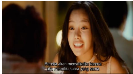
Gambar 9. yakin bisa ganti posisi Ammy

Jeong Min: “ Kau menghilang setahun yang lalu. Mereka telah mencarimu ke mana-mana. Kau mengacaukan album kedua Ammy. Mereka berusaha keras untuk mencari penggantinya. ” Hanna/Jenny: “ Aku bisa menjadi penggantinya. Mereka akan menyukaiku karena aku memiliki suara yang sama. Tidak? ” (Hanna/Jenny menjawab dengan sangat yakin, berpegang pada logikanya sendiri bahwa suaranya sama persis. Ia tidak peduli apakah orang lain setuju atau menolaknya, karena baginya fakta itu sudah cukup.) (D-9/PC-2006/Scene 30/45:01)