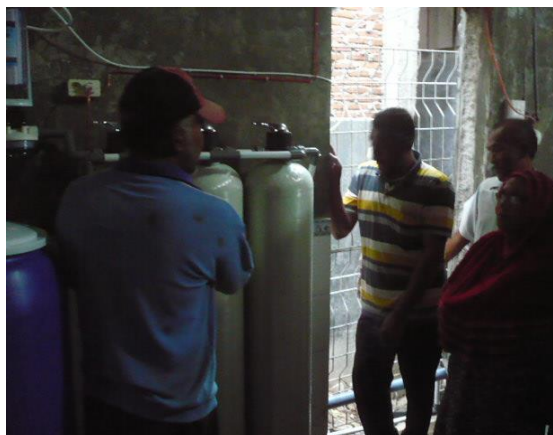
Gambar 6. Peserta sedang mendengarkan penjelasan prinsip kerja dan pemeliharaan alat penjernihan air.

Kegiatan IbM ini telah menghasilkan luaran berupa prototipe penjernihan air payau multi filter yang dapat menghasilkan air bersih dan air minum.