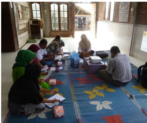
Gambar 4. Peserta kegiatan IbM sedang mengisi pretest yang diberikan tim IbM.

Pada sesi pelatihan tersebut diberikan pretest dan post test tentang air bersih dan pengolahannya. Pretest diberikan dengan tujuan untuk mengetahui pemahaman masyarakat terhadap air bersih dan pengolahannya. Selanjutnya post test diberikan setelah pelatihan selesai dilakukan. Dari hasil pretest dan post test diketahui wawasan masyarakat terhadap air bersih dan pengolahannya sudah sangat baik, tetapi karena keterbatasan dana, mereka tidak mampu membuat alat pengolahan air payau menjadi air bersih.