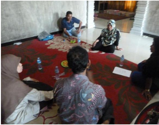
Gambar 2. Penjelasan dan diskusi dengan pemuka asyarakat Desa Pusong

Kegiatan dilanjutkan dengan sosialisasi mengenai pelatihan alat multi filter untuk mengolah air di lokasi yang dipilih yaitu meunasah desa yang dihadiri oleh sebagian masyarakat desa pusong (Gambar 3 dan Gambar 4).