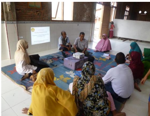
Gambar 3. Tim IbM sedang melakukan pelatihan kepada masyarakat desa Pusong Baru.

Kegiatan dilanjutkan dengan sosialisasi mengenai pelatihan alat multi filter untuk mengolah air di lokasi yang dipilih yaitu meunasah desa yang dihadiri oleh sebagian masyarakat desa pusong (Gambar 3 dan Gambar 4).