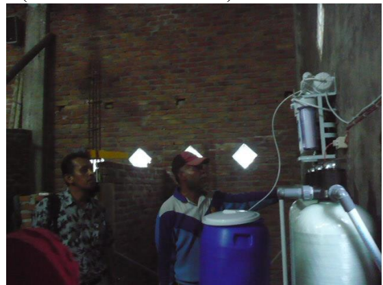
Gambar 5. Tim IbM dan peserta sedang merakit alat penjernihan air.

Setelah selesai tahap sosialisasi dan pelatihan, dilakukan perakitan dan penjelasan prinsip kerja yang dilakukan bersama tim IbM dan peserta selama 3 hari (Gambar 5 dan Gambar 6).