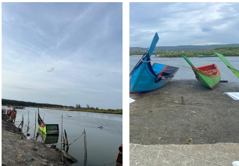
Gambar 4. Kondisi kolam pelabuhan PP Lambada