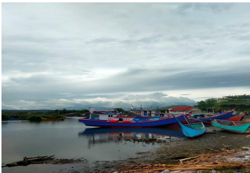
Gambar 3. Dermaga pendaratan ikan

memilih mendaratkan kapalnya di wilayah pasar karena lokasi parkir kapal sangatlah dekat dibandingkan dengan pelabuhan perikanan.