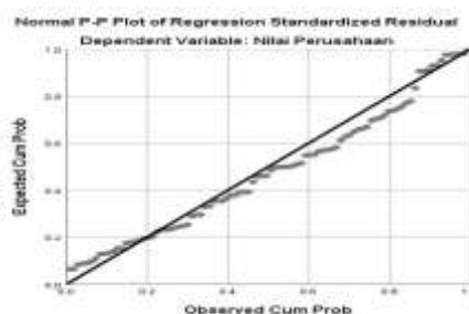
Gambar 1. Hasil Uji Normalitas