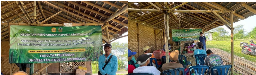
Gambar 2. Sosialisasi dan Penyuluhan Pemanfaatan Kasgot