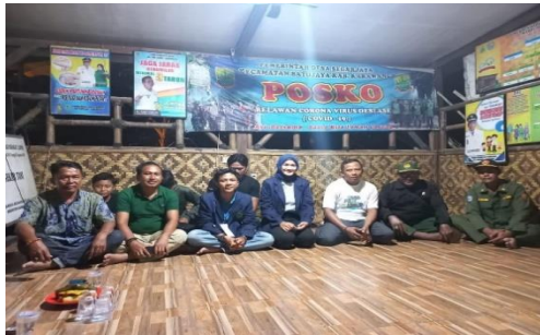
Gambar 1. Sosialisasi Pokdarwis

Kegiatan Pertama yang dilakukan oleh adalah melakukan sosialisasi/sharing session tentang Pokdarwis di Saung Pak Kepala Desa bersama pengurus pokdarwis desa Segarjaya pada tanggal 3 september 2022. Penulis melakukan persentasi terkait tentang potensi wisata yang dimiliki Desa Segarjaya, Kondisi Desa Segarjaya saat ini hingga peranan Pokdarwis dalam pariwisata berkelanjutan. Sosialisasi ini ada 10 orang yang hadir. Setelah melakukan pembahasan ada sebuah permasalahan lahan di pulau putri yang tidak kunjung usai. Masyarakat tidak mau terbuka, Pemerintah desa mengalami kesulitan dalam mengembangkan destinasi Wisata. Akses jalan merupakan unsur terpenting dalam pariwisata karena untuk menunjang pariwisata berkelanjutan. Pak Jana Sekretaris pokdarwis memohon bantuannya dari rekan-rekan mahasiswa barangkali mempunyai solusi untuk permasalahan yang terjadi di Pulau Putri memberikan pemahaman terhadap masyarakat.