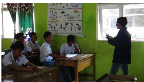
Gambar 2. Pelatihan Kepemimpinan

Kegiatan Pertama yang dilakukan oleh adalah melakukan sosialisasi/sharing session tentang Pokdarwis di Saung Pak Kepala Desa bersama pengurus pokdarwis desa Segarjaya pada tanggal 3 september 2022. Penulis melakukan persentasi terkait tentang potensi wisata yang dimiliki Desa Segarjaya, Kondisi Desa Segarjaya saat ini hingga peranan Pokdarwis dalam pariwisata berkelanjutan. Sosialisasi ini ada 10 orang yang hadir. Setelah melakukan pembahasan ada sebuah permasalahan lahan di pulau putri yang tidak kunjung usai. Masyarakat tidak mau terbuka, Pemerintah desa mengalami kesulitan dalam mengembangkan destinasi Wisata. Akses jalan merupakan unsur terpenting dalam pariwisata karena untuk menunjang pariwisata berkelanjutan. Pak Jana Sekretaris pokdarwis memohon bantuannya dari rekan-rekan mahasiswa barangkali mempunyai solusi untuk permasalahan yang terjadi di Pulau Putri memberikan pemahaman terhadap masyarakat.