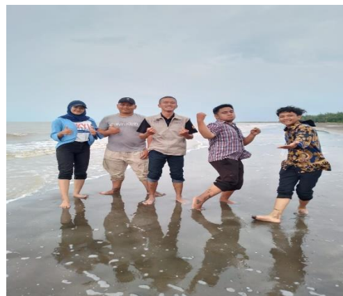
Gambar 3. Mengajak Komunitas GenPi Bekasi

Pada kegiatan kedua adalah melakukan pelatihan kepemimpinan ( Leadership ) bagi siswa SMK Bina Ilmu Mandiri Kelas XI. Kepemimpinan merupakan hal terpenting dalam organisasi apapun. Setiap manusia harus mempunyai jiwa kepemimpinan agar dapat bertanggung jawab atas semua yang telah dilakukannya dan yang terpenting adalah kejujuran untuk kehidupan yang lebih baik. Pelatihan ini diikuti 16 orang siswa kelas XI. Dalam pelatihan ini penulis menjelaskan arti dari pemimpin dan kepemimpinan, fungsi pokok pemimpin, tipe-tipe kepemimpinan dan kriteria serta sifat seorang pemimpin. Dari pelatihan ini penulis berharap siswa-siswi dapat menjadi kader-kader penerus bangsa dalam pembangunan nasional dan agen perubahan untuk Indonesia Maju. Pada kegiatan ini juga pemateri memberikan 3 pertanyaan tentang kepemimpinan yang harus di jawab oleh partisipan yang hadir dan akan diberikan hadiah bagi siapa saja yang menjawabnya.