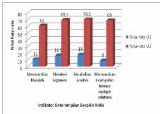
Gambar 1. Penguasaan indikator keterampilan berpikir kritis

perangkat pembelajaran yang dikembangkan.