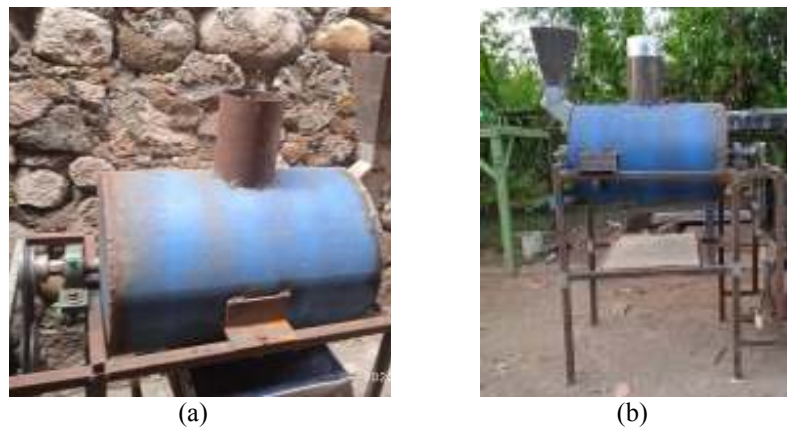
Gambar 1. (a) mesin penyangrai tanpa exhaust fan . (b) dengan exhaust fan

Proses penyangraian dilakukan pada dua mesin penyangrai yaitu sebelum, dan sesudah dilakukan modifikasi penambahan exhaust fan . Mesin penyangrai dapat dilihat pada gambar di bawah ini.