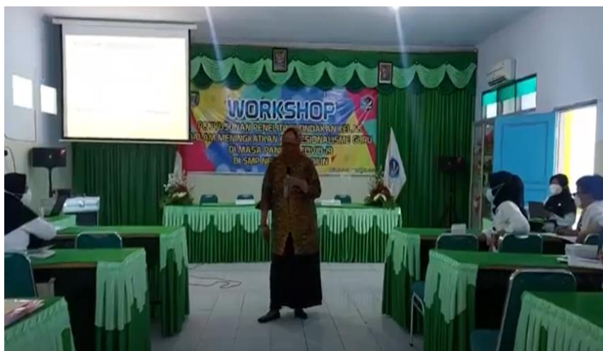
Gambar 2. Penyampaian materi PTK Berbasis TIK

Tahapan kedua adalah penyampaian materi PTK oleh pemateri. Materi yang disampaikan adalah tentang pentingnya melakukan penelitian tindakan kelas di masa pandemi. Pelatihan ini diharapkan guru dapat mengetahui manfaat dan bagaimana pelaksanaan PTK selama pembelajaran daring berlangsung. Kegiatan ini dilakukan dengan diskusi dan tanya jawab secara interaktif. Guru banyak bertanya tentang penerapan PTK secara kontekstual yang dapat dilakukan secara mandiri. Selain itu guru juga bertanya tentang pemaknaan dari PTK dalam kaitannya dengan kondisi pembelajaran jarak jauh. Pemateri memberikan pengetahuan tentang contoh-contoh riil yang dapat dilakukan. Selain itu tim juga menjelaskan makna PTK untuk meningkatkan prestasi belajar siswa selama pembelajaran jarak jauh berlangsung (Arends, 2008).