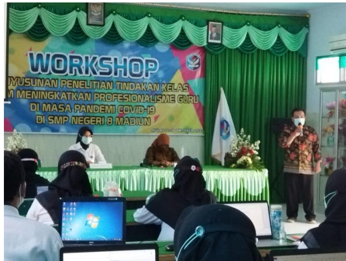
Gambar 1. Pembukaan dan sambutan

dihasilkan. Acara ini juga disambut oleh kepala SMP 8 Kota Madiun. Adanya dukungan dan motivasi kelembagaan sangat penting untuk penguatan kompetensi guru.