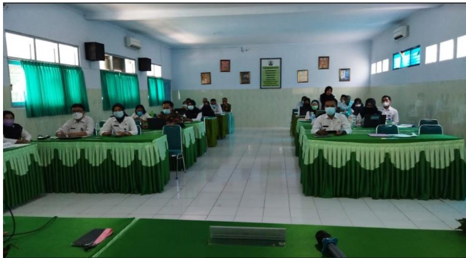
Gambar 3. Peserta pelatihan PTK

Penelitian Tindakan Kelas bertujuan untuk memperbaiki praksis pembelajaran dan meningkatkan ketrampilan guru dalam menanggulangi permasalahan yang muncul di kelas (Pujawan and Restami, 2018).