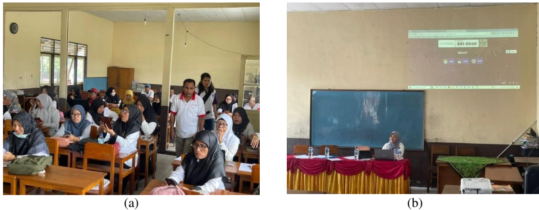
Gambar 4. Post-test melalui aplikasi Kahoot (a) peserta sedang mengerjakan tes (b) tampilan link Kahoot

Hasil pre-test , post-test dan interpretasinya dapat dilihat pada Tabel 3 berikut.