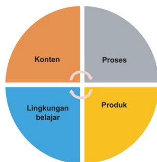
Gambar 1. Aspek pembelajaran berdiferensiasi

Pembelajaran berdiferensiasi memiliki dampak yang baik bagi kemampuan maupun prestasi belajar siswa. Hasil penelitian Herwina (2021) menunjukkan bahwa pembelajaran berdiferensiasi dapat membantu siswa mencapai hasil belajar optimal. Sejalan dengan hal tersebut, hasil penelitian Dista dkk (2024) juga menunjukkan bahwa pembelajaran berdiferensiasi berpengaruh signifikan terhadap kemampuan kognitif siswa sekolah dasar. Sedangkan menurut Noviyanti dkk (2023), kemampuan computational thinking siswa sekolah dasar mengalami peningkatan setelah diberi perlakuan pembelajaran berdiferensiasi. Dalam kaitannya dengan matematika, hasil penelitian Kamal (2021) juga menunjukkan bahwa dengan diterapkannya diferensiasi dalam pembelajaran, aktivitas dan hasil belajar matematika siswa meningkat.