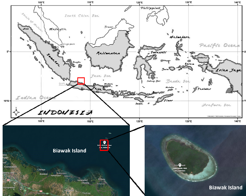
Gambar 2. Peta lokasi penelitian

Penelitian ini dilakukan di Kepulauan Biawak, Kabupaten Indramayu, Provinsi Jawa Barat. Waktu pelaksanaan penelitian dilakukan pada 2 periode yang berbeda. Periode pertama dilakukan pada tanggal 2-6 Juli 2018 dan periode kedua yaitu pada tanggal 2-6 Oktober 2018. Lokasi penelitian dapat dilihat pada Gambar 2.