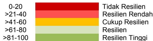
Gambar 3. Klasifikasi tingkat resiliensi

Nilai indeks resiliensi nelayan digunakan untuk melihat kapasitas nelayan dalam beradaptasi terhadap perubahan yang terjadi. Indikator yang digunakan dalam penilaian IRN diberikan skor setiap berdasarkan kriteria penilaian (skala likert) dari hasil wawancara dengan responden. Penilaian dari setiap parameter didapat dari rata-rata skor dari jumlah responden. Perhitungan integrasi nilai-nilai dari indeks resiliensi nelayan dapat direpresentasikan dalam suatu komposit geometri seperti yang telah dijelaskan dalam rumus persamaan (1).