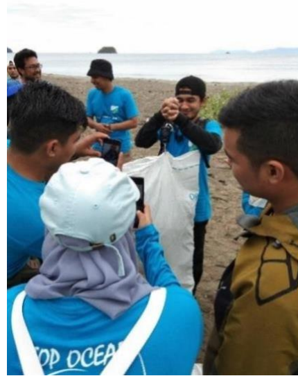
Gambar 6. Kegiatan Penimbangan sampah

Berdasarkan tabel 1 diatas, maka jenis sampah botol plastik paling banyak ditemukan. Sebanyak 500 botol plastik dari berbagai merek ditemukan di pantai Lamtengoh, dengan berat 51,1 kg yang paling mendominasi. Selanjutnya sampah plastik kresek dengan berat 6,3 kg dan plastik sachet 5,3 kg. Jenis sampah pipet/sedotan plastik juga masih banyak ditemui di pantai ini. Ada sebanyak 65 sedotan plastik yang berhasil dikutipkan pada saat kegiatan itu. Kategori sampah campuran juga tergolong banyak, dengan berat 6,8 kg. Hal ini menunjukkan bahwa di lokasi pantai Lamtengoh masih banyak masyarakat yang suka membuang sampah plastik sembarangan. Di lokasi pantai tersebut juga belum menyediakan tempat buang sampah yang khusus, sehingga banyak pengunjung dan masyarakat yang masih suka membuang sampah secara sembarangan.