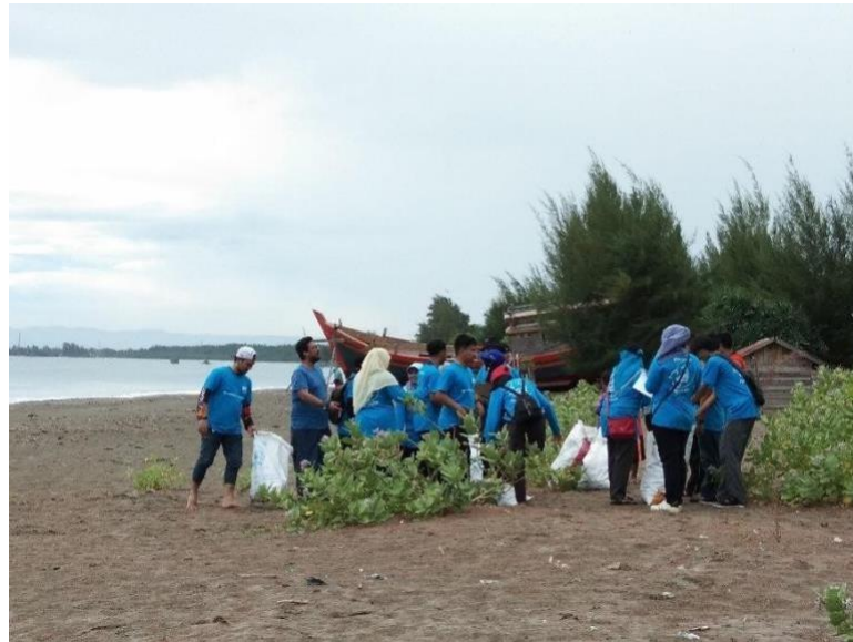
Gambar 3. Kegiatan pengutipan sampah

Selama proses pengutipan sampah berlangsung, peserta banyak menemukan berbagai jenis sampah plastik, botol plastik, kain, pipet plastik dan lain sebagainya. Peserta juga mengedukasikan kepada anak-anak nelayan setempat untuk tidak membuang alat tangkap berupa jaring ke daerah laut, karena akan berdampak kepada biota laut yang ada di perairan sekitar. Hal ini dapat dilihat dari gambar 4 berikut ini.