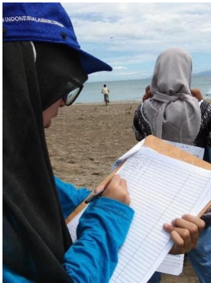
Gambar 5. Kegiatan Pencatatan sampah