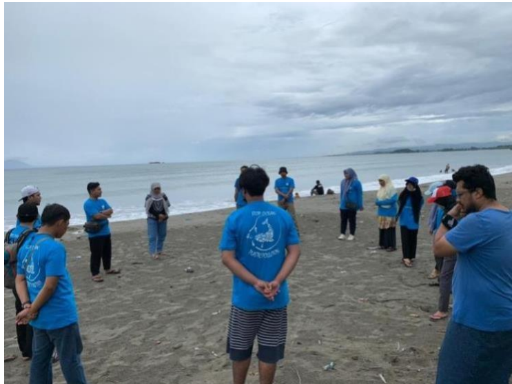
Gambar 2. Situasi saat edukasi tentang kebersihan pantai

Adapun beberapa pertanyaan yang ditanyakan oleh peserta dalam hal ini adalah: (1). mengapa plastik di laut berbahaya? Dari pertanyaan ini kemudian dapat dijelaskan bahwa sampah plastik yang tersebar dalam laut sangat berbahaya, yaitu: (a) Plastik yang ukurannya kecil dapat dimakan ikan, kemudian akan terakumulasi dalam tubuh ikan. Apabila ikan tersebut dikonsumsi manusia, maka plastik tersebut akan termakan manusia. Padahal plastik merupakan bahan yang membahayakan kesehatan bila termakan manusia atau hewan (b) Mengakibatkan kemiskinan manusia, terutama masyarakat pesisir pantai yang bekerja sebagai nelayan. Mengapa demikian, karena disamping berdampak pada perikanan. Banyak ikan mati, ikan yang tercemar, juga pada bidang perkapalan, dan pariwisata. Apabila banyak sampah plastik di laut maka akan menghambat pergerakan kapal. Apabila banyak sampah plastik di laut akan mengganggu keindahan pantai sehingga wisatawan akan menjadi kurang tertarik pada pantai yang tercemar tersebut.