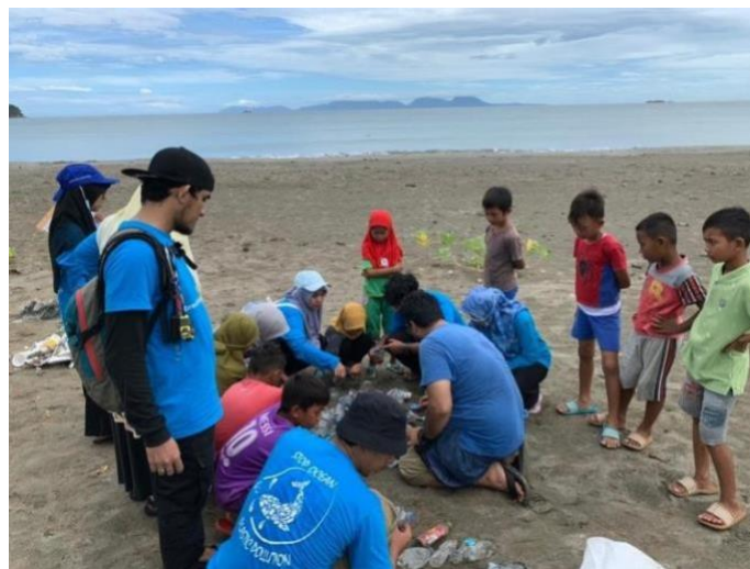
Gambar 4. Edukasi sampah bagi anak-anak nelayan

Selama proses pengutipan sampah berlangsung, peserta banyak menemukan berbagai jenis sampah plastik, botol plastik, kain, pipet plastik dan lain sebagainya. Peserta juga mengedukasikan kepada anak-anak nelayan setempat untuk tidak membuang alat tangkap berupa jaring ke daerah laut, karena akan berdampak kepada biota laut yang ada di perairan sekitar. Hal ini dapat dilihat dari gambar 4 berikut ini.