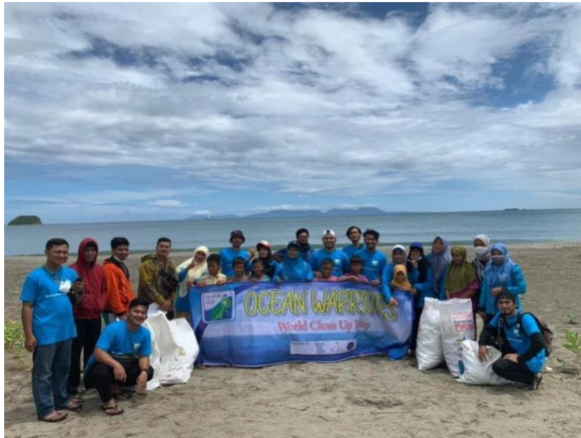
Gambar 7. Foto bersama tim kegiatan bersih sampah