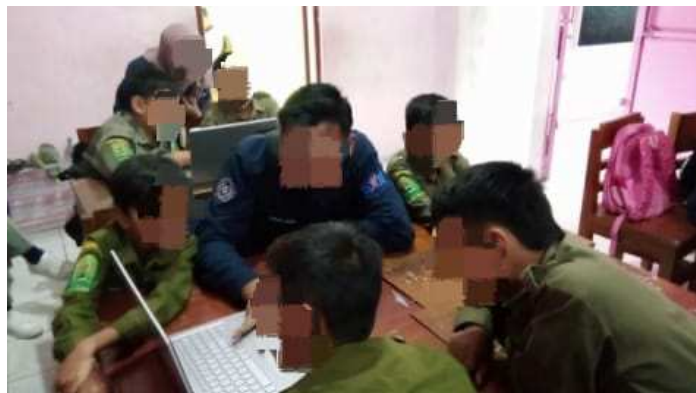
Gambar 2. Pendampingan Kedua

pembelajaran. Dengan praktik langsung yang menyenangkan, peserta didik mulai memahami bahwa teknologi digital seperti Microsoft Word dapat digunakan untuk membuat dokumen yang lebih menarik, rapi, dan fungsional sesuai kebutuhan pembelajaran.