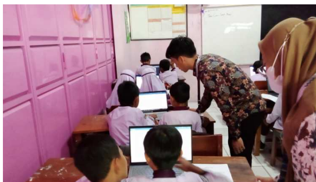
Gambar 3. Pendampingan Ketiga