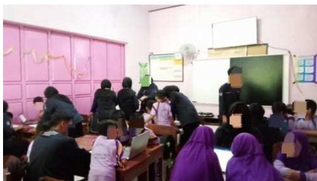
Gambar 1. Pendampingan Pertama

Pendampingan tahap kedua dalam program literasi digital melalui pelatihan penggunaan Microsoft Word dilaksanakan pada hari Sabtu, 11 Februari 2023. Kegiatan ini dilangsungkan secara langsung di dua kelas, yaitu kelas IV A dan IV B di MI Muhammadiyah Ceporan. Seperti pada pelaksanaan sebelumnya, peserta didik tetap dibagi ke dalam lima kelompok kecil yang sama. Pembagian kelompok yang konsisten ini bertujuan untuk menjaga kenyamanan siswa serta memperkuat kerja sama antarpeserta dalam kelompok yang telah terbentuk. Pendekatan ini dinilai efektif dalam menciptakan suasana belajar yang lebih kondusif