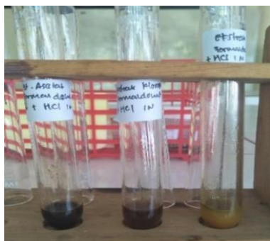
Gambar 1. Pengujian jenis golongan tanin

senyawa fenol lainnya karena sifat tanin dapat mengendapkan protein. Berdasarkan tabel 1 ke tiga fraksi menunjukkan adanya endapan putih, hal ini berarti dalam fraksi yang diuji mengandung tanin.