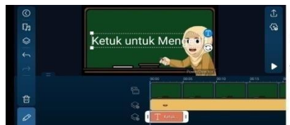
Gambar 3.11 Memasukkan Teks ke dalam Media