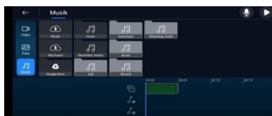
Gambar 3.17 Memasukkan Rekaman Penjelasan Materi