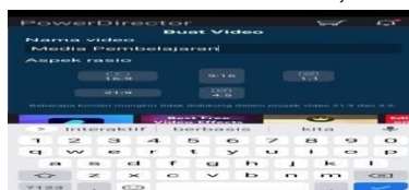
Gambar 3.7 Menulis Nama Video dan Memilih Rasio