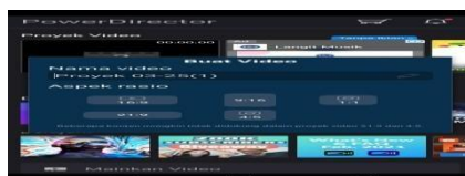
Gambar 3.6 Mulai Membuat Video Pembelajaran