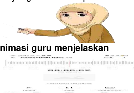
Gambar 3.1 Animasi guru menjelaskan

Merancang media yang dimaksud adalah media pembelajaran yang dibuat adalah berbentuk video pembelajaran. Video pembelajaran yang dibuat dalam bentuk animasi. Karena video pembelajaran berbentuk animasi terlebih dulu mengumpulkan gambar-gambar yang mendukung pembuatan video, seperti gambar papan tulis yang menjadi backgarund dari media, gambar animasi seorang guru yang sedang menjelaskan, gambar mulut berbicara untuk menyesuaikan rekaman penjelasan materi dengan mulut yang bergerak. Kemudian peneliti merekam suara menjelaskan materi yang akan di sampaikan.