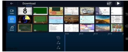
Gambar 3.8 Memasukan Background Media Pembelajaran