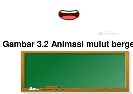
Gambar 3.2 Animasi mulut bergerak