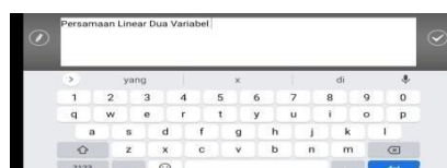
Gambar 3.12 Pengetikan Materi Pembelajaran