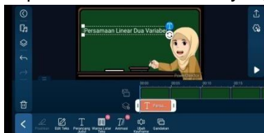
Gambar 3.13 Masukkan Materi ke dalam Media