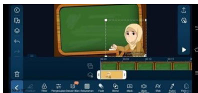
Gambar 3.18 Pencocokan Animasi dengan Suara Rekaman