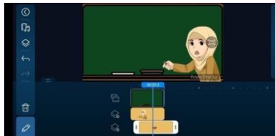
Gambar 3.10 Memasukkan Gambar Mulut Bergerak ke dalam Media