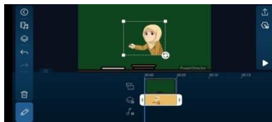
Gambar 3.9 Memasukkan Gambar Animasi Guru ke dalam Media