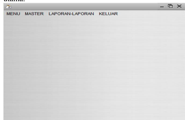
Gambar 3. Halaman Utama Aplikasi

Halaman Utama Aplikasi adalah Halaman Menu Utama keseluruhan Dari Aplikasi Pengolahan Data Bantuan Sosial Kelurahan Muara Dua Menggunakan Vb.Net. Dalam Menu Utama ini terdapat Menu file, transaksi, laporan-laporan dan keluar. Berikut gambar halaman utama: