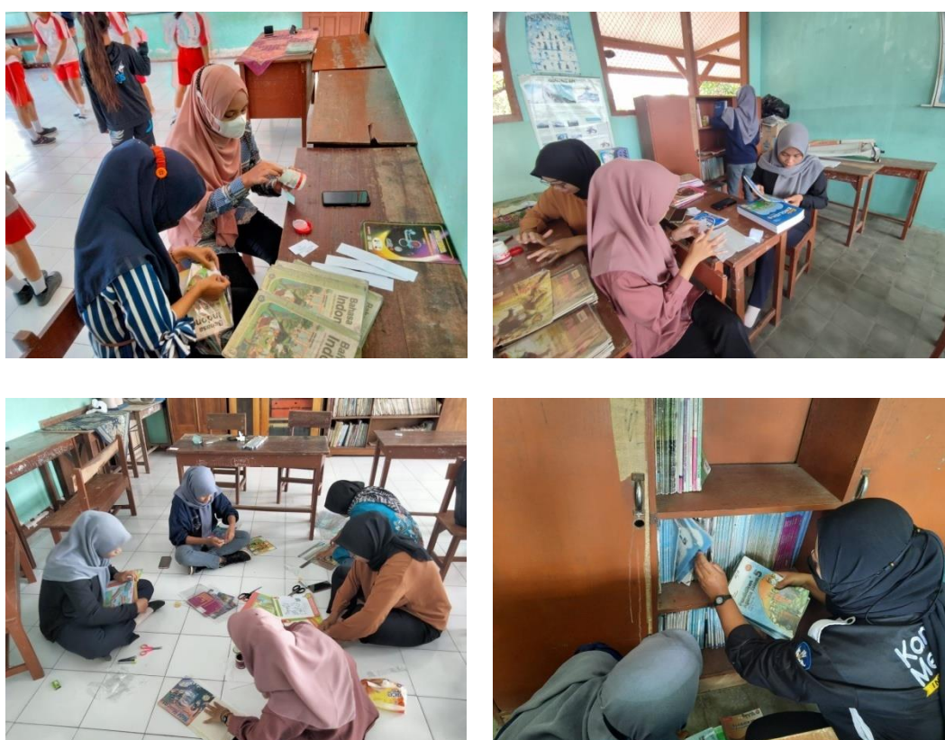
Gambar 5 Kegiatan Labeling, Penyampulan Sekaligus Menata Buku Pada Pojok Literasi.

Kegiatan donasi buku ini dilakukan pada bulan Oktober sampai bulan November 2021. Para mahasiswa kampus mengajar menyebarkan informasi mengenai donasi buku ini melalui sosial media masing-masing mahasiswa. Dalam kegiatan donasi buku yang di selenggarakan oleh mahasiswa kampus mengajar mendapatkan sekitar 93 buku dimana masing-masing buku sudah di pilih dan yang layak di baca oleh siswa-siswi sekolah dasar. Untuk buku yang tidak layak untuk usia sekolah dasar akan diberikan kepada pihak yang membutuhkan.