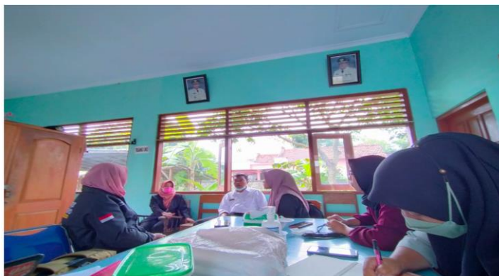
Gambar 2. Koordinasi dengan guru dan sekolah terkait kegiatan abdimas

Kegiatan edukasi/penyuluhan pentingnya budaya literasi dilakukan dengan mengadakan kegiatan 1 buku 1 siswa 1 bulan. Setiap siswa diminta membaca buku bacaan secara rutin setiap bulan. Buku bacaan tidak dibatasi entah dari jenis fiksi maupun non fiksi. Buku bacaan bisa dari milik pribadi, atau meminjam di perpustakaan sekolah. Mahasiswa juga menghimbau untuk memanfaatkan pojok literasi di setiap sudut ruang kelas untuk memupuk budaya literasi. Pada hari besar nasional, tepatnya di hari pahlawan dan sumpah pemuda diadakan lomba telling story untuk mengetahui perkembangan kemampuan budaya literasi siswa.