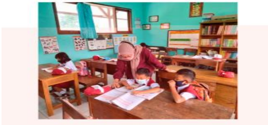
Gambar 4. Kegiatan jam pembelajaran tambahan di SDN 2 Gombang.

Kegiatan jam pembelajaran tambahan, dirasa perlu dilakukan karena kemampuan beberapa siswa di kelas 4-6 belum memenuhi capaian pembelajaran. Peserta dalam kegiatan ini adalah 2 siswa dari kelas 4 dan 5. Siswa diberikan soal dan pemahaman oleh mahasiswa kampus mengajar. Bagi siswa yang belum lancar dalam literasi dan numerasi, akan sulit bagi mereka untuk melanjutkan kegiatan pembelajaran selanjutnya. Karena belum bisa memahami pembelajaran yang di berikan saat itu. Hal ini berpengaruh pada siswa yang belum lancar terhadap literasi dan numerasi. Guru yang tidak telaten dalam pembelajaran pada siswa yang kurang dalam literasi dan numerasi akan menganggap siswa tersebut bodoh dan lambat dalam pembelajaran. Selain itu orang tua yang sudah memasrahkan anaknya untuk belajar di sekolah tidak memperhatikan pembelajaran anak terutama literasi dan numerasi. Hal ini sangat berpengaruh pada nilai siswa yang akhirnya tidak memuaskan.