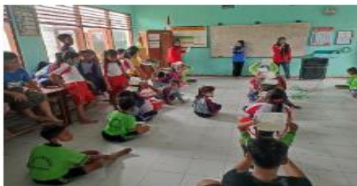
Gambar 3. Kegiatan lomba memperingati hari sumpah pemuda.

Kegiatan edukasi/penyuluhan pentingnya budaya literasi dilakukan dengan mengadakan kegiatan 1 buku 1 siswa 1 bulan. Setiap siswa diminta membaca buku bacaan secara rutin setiap bulan. Buku bacaan tidak dibatasi entah dari jenis fiksi maupun non fiksi. Buku bacaan bisa dari milik pribadi, atau meminjam di perpustakaan sekolah. Mahasiswa juga menghimbau untuk memanfaatkan pojok literasi di setiap sudut ruang kelas untuk memupuk budaya literasi. Pada hari besar nasional, tepatnya di hari pahlawan dan sumpah pemuda diadakan lomba telling story untuk mengetahui perkembangan kemampuan budaya literasi siswa.