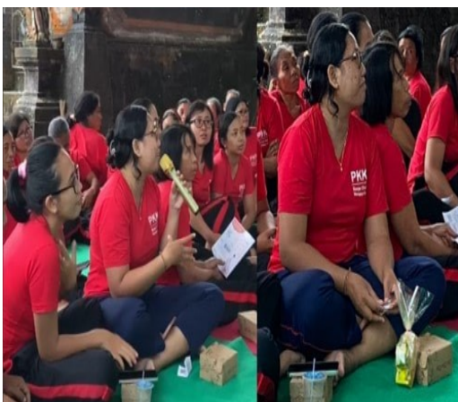
Gambar 5. Sesi tanya jawab

Berdasarkan pada Tabel 3, persentase jawaban tepat terendah pada pre-test berada pada pertanyaan nomor 3 dan 4 dengan nilai <50%. Hasil tersebut menandakan bahwa responden belum mengetahui informasi mengenai golongan obat secara umum. Terdapat 4 golongan obat yaitu obat bebas, obat bebas terbatas, obat keras dan obat narkotika dan 3 golongan obat tradisional yaitu jamu, obat herbal terstandar dan fitofarmaka (Adiyasa, 2021). Dari beberapa golongan tersebut, tidak semua obat dapat digunakan pada ibu hamil dan menyusui (Anggraini et al., 2023).