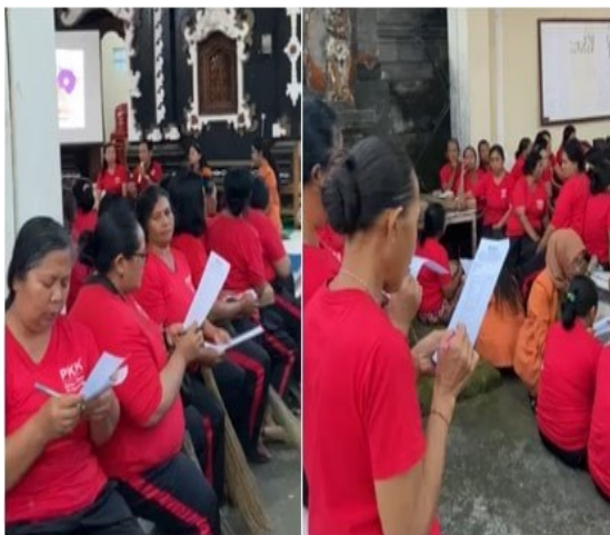
Gambar 6. Pengisian post-test

diperoleh, secara umum kegiatan ini telah berhasil meningkatkan pengetahuan serta menimbulkan antusiasme yang tinggi dalam mengikuti kegiatan PkM ini dilihat dari jumlah responden yang bertanya dan menjawab kuis.