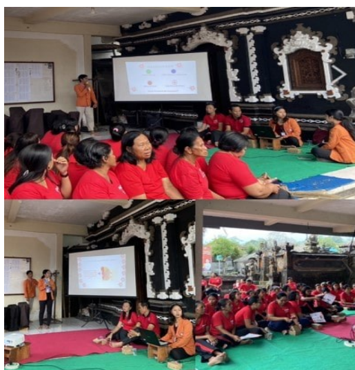
Gambar 2. Penyampaian materi

dalam proses pengisiannya. Terdapat 5 orang responden yang bertanya dan kebingungan terkait maksud pertanyaan dari kuesioner tersebut. Hal ini dikarenakan tidak sedikit responden yang belum mengetahui informasi mengenai jawaban yang tepat dari beberapa pertanyaan yang telah disediakan karena minimnya pemberian edukasi maupun penyuluhan oleh tenaga kesehatan.