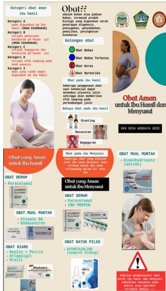
Gambar 4. Leaflet

diberikan serta dengan seksama mendengarkan penyuluhan yang diberikan. Bagi responden yang bertanya juga memperoleh hadiah sebagai bentuk apresiasi.