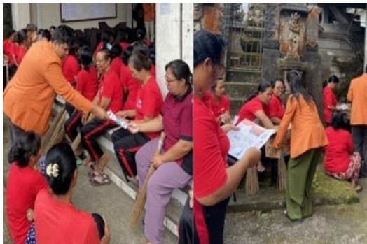
Gambar 3. Pembagian leaflet

Selain itu mereka juga dibekali dengan leaflet yang telah dibagikan memuat materi secara singkat dan padat (Gambar 3 dan 4). Tujuan dari pemberian leaflet adalah sebagai media penunjang dalam memperjelas penyampaian materi. Leaflet memiliki ukuran yang kecil sehingga mudah untuk disimpan dan dibaca ulang dikemudian hari (Aliva et al., 2021).