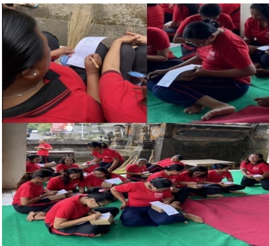
Gambar 1. Pengisian pre-test

Kegiatan ini menyoar pada perkumpulan ibu-ibu karena wanita dianggap berperan penting dalam menjaga kesehatan diri dan anggota keluarganya. Selain itu wanita juga lebih peduli pada lingkungan sekitarnya sehingga harapannya dapat menyebarkan informasi kepada sanak saudara dan masyarakat sekitar (Robiyanto et al., 2018; Ratnasari, 2010).