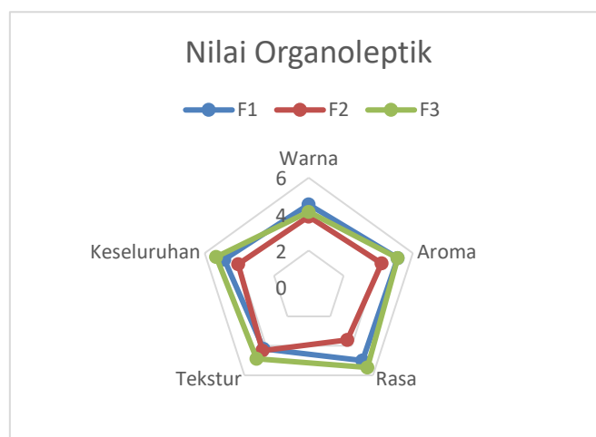
Gambar 2. Hasil Uji Organoleptik