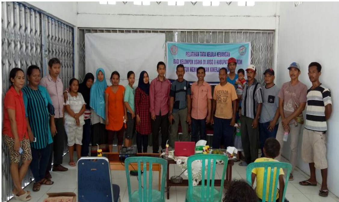
Gambar 3. Foto Bersama Pelaku UMKM