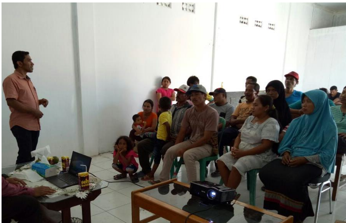
Gambar 1. Memberikan Pemahaman Tentang Pencatatan dan Pengelolaan Keuangan

Setelah mengikuti pelatihan yang mengedepankan pendekatan partisipatif dan praktik langsung, peserta menunjukkan peningkatan pemahaman yang signifikan. Post-test yang dilakukan pada akhir pelatihan mencatat kenaikan rata-rata skor yang menggambarkan bahwa peserta mulai memahami konsep dasar tata kelola keuangan, manfaat pencatatan transaksi, serta bagaimana membaca dan menyusun laporan laba rugi dan arus kas.