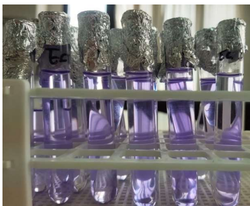
Gambar 1. Tabung Uji Antibiofilm