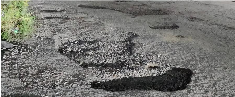
Gambar. 1 Jalan Belimbing yang rusak dan belum diperbaiki

Gambar. 2 merupakan jalan Belimbing yang rusak dan belum diperbaiki. Tetapi berdasarkan data jalan yang sudah diperbaiki, jalan Belimbing ini termasuk ke dalam jalan yang keterangannya sudah diperbaiki. Namun kenyataannya dilapangan belum ada dilakukannya perbaikan. Perbaikan jalan yang rusak sangat penting dilakukan segera untuk mencegah kerusakan yang lebih parah, mengurangi risiko kecelakaan, dan memastikan kelancaran mobilitas masyarakat serta distribusi barang dan jasa.