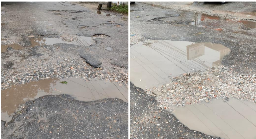
Gambar. 1 Kondisi ruas Jalan Melur yang rusak dan tergenang

Secara cepat atau lambat jalan akan mengalami penurunan tingkat pelayanan. Menurunnya tingkat pelayanan jalan akan ditandai dengan adanya kerusakan pada jalan, kerusakan yang terjadi juga bervariasi pada setiap segmen di sepanjang ruas jalan apabila dibiarkan dalam jangka waktu yang lama, maka akan semakin memperparah kerusakan ruas jalan itu sendiri dan akan memberikan rasa kurang aman dan nyaman terhadap pengguna jalan. Pada dasarnya setiap wilayah akan mengalami penurunan dan berusaha untuk terus menuju proses tumbuh dan berkembang sebagai jawaban atas berkembangnya kebutuhan masyarakat kota, kabupaten atau wilayah yang mampu memberi lahan penghidupan yang layak.