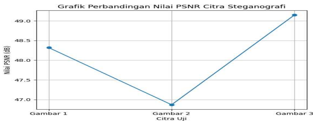
Gambar 2: Grafik Perbandingan Nilai PSNR Citra Steganografi

Untuk memperjelas hasil pengujian kualitas citra, dibuat grafik perbandingan nilai PSNR antara beberapa citra uji seperti ditunjukkan pada Gambar 2.