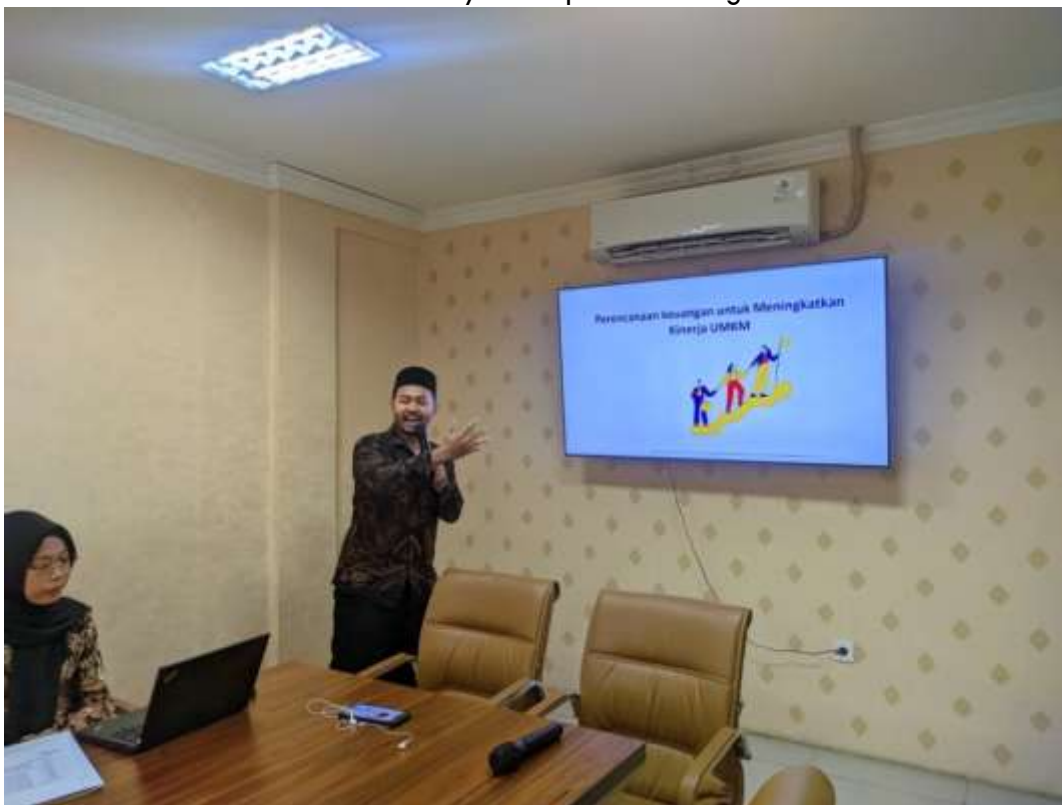
Gambar 2. Pengelolaan Keuangan UMKM Dengan Menggunakan Sistem Aplikasi Akuntansi

Survei dan observasi lapangan menunjukkan bahwa sebagian besar UMKM masih mencatat keuangan secara manual, mencampurkan keuangan pribadi dan usaha, serta belum memiliki laporan keuangan sesuai standar. Hal ini menghambat pengelolaan keuangan yang efektif. Oleh karena itu, penggunaan aplikasi akuntansi dipandang sebagai solusi praktis untuk membantu UMKM mencatat transaksi secara terstruktur dan menyusun laporan keuangan sesuai SAK EMKM.