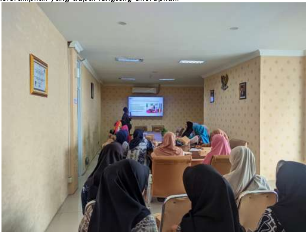
Gambar 3. Pelatihan Pengelolaan Keuangan UMKM Dengan Menggunakan Sistem Aplikasi Akuntansi

Tahapan selanjutnya dalam pengabdian adalah melakukan pelatihan pengelolaan keuangan UMKM dengan menggunakan aplikasi akuntansi. Tujuan pelatihan ini adalah untuk meningkatkan pemahaman dan keterampilan pelaku UMKM dalam mengelola keuangan usahanya secara efektif. Pelatihan dilakukan secara praktis, dengan materi yang mencakup contoh transaksi nyata dan studi kasus. Peserta UMKM diberi kesempatan untuk langsung mencoba aplikasi akuntansi untuk mencatat transaksi, menyusun laporan keuangan, dan mengevaluasi kondisi keuangan usaha (Febriansah et al., 2024). Pendekatan interaktif akan dapat memastikan pelaku UMKM tidak hanya memperoleh pengetahuan tetapi juga keterampilan yang dapat langsung diterapkan.