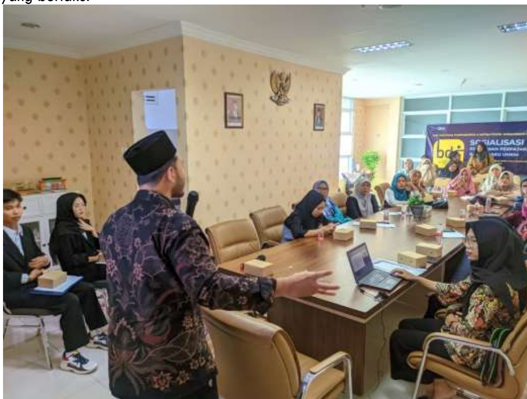
Gambar 4. Pelatihan Pengelolaan Keuangan UMKM Dengan Menggunakan Sistem Aplikasi Akuntansi

Pengabdian ini bertujuan untuk menilai efektivitas pelatihan pengelolaan keuangan UMKM berdasarkan SAK EMKM dengan menggunakan aplikasi akuntansi (Nasihin, Purwandari, Lasmini, & Ardiansyah, 2025). Evaluasi dilakukan melalui tes tertulis untuk mengukur pemahaman konsep dan prinsip penyusunan laporan keuangan, serta praktik langsung di mana peserta diminta menyusun laporan keuangan menggunakan aplikasi akuntansi. Selain itu, evaluasi berkala dilakukan melalui monitoring setiap bulan untuk memastikan para pelaku UMKM dapat menerapkan pengetahuan yang diperoleh. Pendampingan dilakukan dengan membuat grup WhatsApp untuk memudahkan pelaku UMKM bertanya jika mengalami kesulitan dalam melakukan pencatatan keuangan menggunakan aplikasi akuntansi, serta memberikan bantuan langsung di lokasi Pojok Wirausaha (Kareja et al., 2022). Pendampingan ini bertujuan untuk memastikan pelaku UMKM dapat menyusun laporan keuangan yang terstruktur, akurat, dan sesuai dengan standar akuntansi yang berlaku.