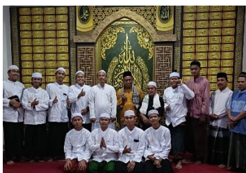
Gambar 4. Pelibatan generasi muda Sumber: Grup Musholla An-Nur, 2024

Aspek ini meliputi: (1) Metode Penyampaian dengan Penggunaan Media Digital ; Dengan kemajuan teknologi, informasi tentang acara Maulid Arba'in semakin sering disebarluaskan baik melalui pesan teks maupun video dan konten digital lainnya. Generasi muda, yang lebih akrab dengan teknologi, menjadi penggerak dalam pembuatan konten ini untuk dibagikan di media sosial; (2) Partisipasi dalam Kegiatan . Ini meliputi dua hal, yaitu, pertama , Pelibatan Generasi Muda: Generasi muda dilibatkan dalam setiap tahapan kegiatan, mulai dari perencanaan hingga pelaksanaan. Dengan melibatkan mereka, informasi tentang tradisi tidak hanya disampaikan, tetapi juga dipraktikkan secara langsung, sehingga lebih mudah diingat dan diterapkan.