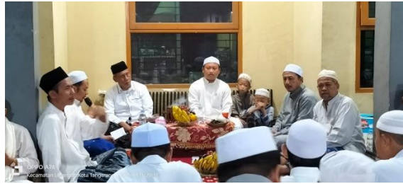
Gambar 5. Dokumentasi kegiatan maulid

(3). Feedback dan Evaluasi . Ini meliputi dua hal yaitu, pertama , Umpan Balik Melalui Media Sosial: Anggota komunitas dapat memberikan umpan balik tentang kegiatan melalui komentar di media sosial, yang membantu panitia memahami tanggapan masyarakat dan melakukan perbaikan di masa mendatang. Kedua , Evaluasi Acara: Setelah acara selesai, evaluasi dilakukan melalui diskusi atau survei informal, yang menjadi wadah bagi anggota untuk berbagi pendapat dan saran terkait penyelenggaraan acara.