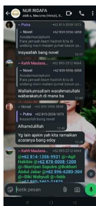
Gambar 7. Komunikasi keberlanjutan

(3). Membangun Jaringan Sosial. Pertama , Jaringan Dukungan: Komunitas yang kuat menciptakan jaringan dukungan di mana anggota saling membantu dalam berbagai aspek kehidupan, bukan hanya dalam konteks acara tradisi. Ini menciptakan rasa aman dan saling percaya di antara anggota. Kedua , Komunikasi Berkelanjutan: Dengan memanfaatkan berbagai saluran komunikasi, anggota komunitas tetap terhubung dan saling berbagi informasi, pengalaman, dan sumber daya.