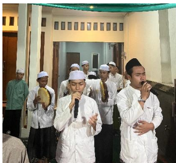
Gambar 6. Seni musik hadrah

(3). Membangun Jaringan Sosial. Pertama , Jaringan Dukungan: Komunitas yang kuat menciptakan jaringan dukungan di mana anggota saling membantu dalam berbagai aspek kehidupan, bukan hanya dalam konteks acara tradisi. Ini menciptakan rasa aman dan saling percaya di antara anggota. Kedua , Komunikasi Berkelanjutan: Dengan memanfaatkan berbagai saluran komunikasi, anggota komunitas tetap terhubung dan saling berbagi informasi, pengalaman, dan sumber daya.