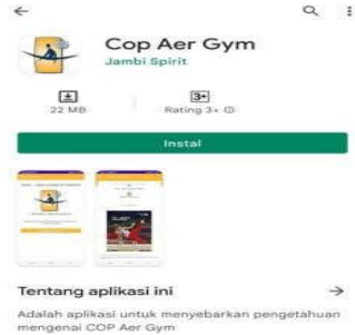
Gambar 2. Tampilan Lay-out Produk Penelitian

Produk aplikasi ini berupa code of point aerobic gymnastic berisi tentang peraturan-peraturan pertandingan serta gerakan yang benar. Adapun produk aplikasi yang telah diperiksa dan divalidasi oleh para ahli adalah sebagai berikut: