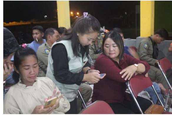
Gambar 2. Pelatihan aplikasi digital desa