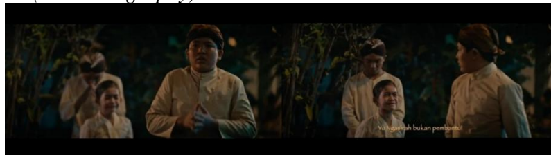
Gambar 6. Teknik Rack Focus