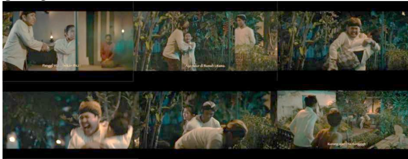
Gambar 4. Perilaku Kartini dan Kakaknya

dominasi laki-laki. (Bhasin, 1993). Namun, respons Kartini yang menampik dan menerkam abangnya menunjukkan tindakan agresi terhadap dominasi abangnya yang ditampilkan pada gambar 4 (C. Scott, 1992).