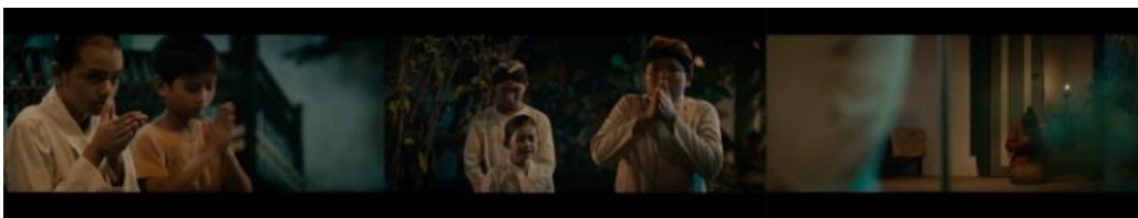
Gambar 5. Perilaku nyembah seluruh anggota keluarga (Sumber: Netflix)

Selain itu, ada perilaku lain yaitu nyembah untuk menghormati RM Sosroningrat sebagai kepala keluarga ditampilkan pada gambar 5. Perilaku tersebut menunjukkan penghormatan kepada laki-laki sebagai pemimpin perempuan pada struktur keluarga patriarki (Asmarani, 2017).