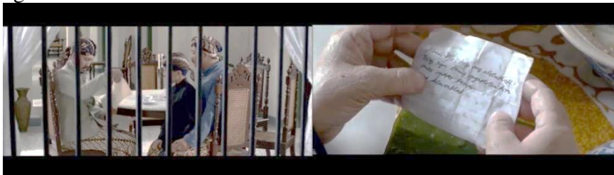
Gambar 10. Kertas untuk mengelabui kakaknya dan transkrip diterima Ovinksoer

Pada saat Kartini, Rukmini dan Kardinah akan keluar untuk mengantarkan makanan dan tulisannya, mereka tidak diperkenankan keluar oleh penjaga gerbang karena tidak diizinkan oleh kakaknya, Slamet. Adegan ini ditampilkan pada gambar 9. Penjaga tersebut menawarkan untuk menawarkan, tetapi tulisan tersebut malah diserahkan ke kakak lelaki Kartini, kemudian tulisan tersebut dibakar. Behaviour atau pergerakan tersebut memperlihatkan bagaimana Slamet membatasi gerak para adiknya dengan budaya pingitan.