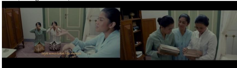
Gambar 8. Aktivitas yang dilakukan Kartini dan adik-adiknya

Pada saat adegan memasuki kamar pingitan yang ditampilkan pada gambar 8, Kartini memerintahkan Rukmini dan Kardinah supaya menyembah untuk menunjukkan kekuasaannya di kamar tersebut. Tetapi Kartini menunjukkan kekuasaan untuk mengajari adik-adiknya agar menjadi otonom dan mandiri tanpa terikat pingitan yang membatasi gerak mereka. Kekuasaannya di kamar tersebut diperlihatkan dengan memerintahkan adik-adiknya untuk bersimpu sambil menyembah dengan maksud mengejek budaya nyembah. Kartini tidak ingin adiknya terkungkung budaya pingitan dan ingin adiknya berpikiran maju seperti dirinya.