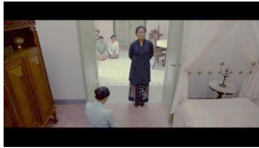
Gambar 7. Ruang Pingitan