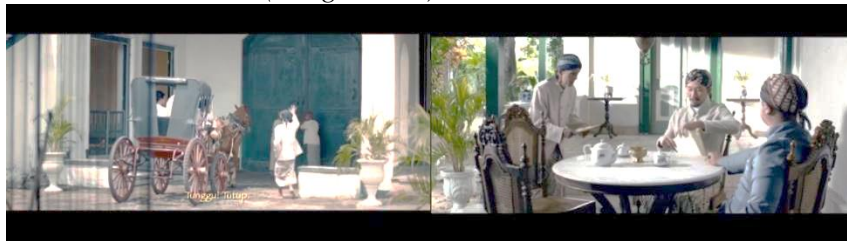
Gambar 9. Kartini tidak diperbolehkan keluar kadipaten

Pada saat Kartini, Rukmini dan Kardinah akan keluar untuk mengantarkan makanan dan tulisannya, mereka tidak diperkenankan keluar oleh penjaga gerbang karena tidak diizinkan oleh kakaknya, Slamet. Adegan ini ditampilkan pada gambar 9. Penjaga tersebut menawarkan untuk menawarkan, tetapi tulisan tersebut malah diserahkan ke kakak lelaki Kartini, kemudian tulisan tersebut dibakar. Behaviour atau pergerakan tersebut memperlihatkan bagaimana Slamet membatasi gerak para adiknya dengan budaya pingitan.