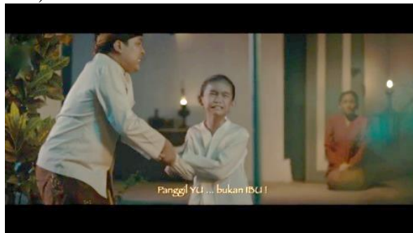
Gambar 1. Wardrobe yang digunakan Kartini

Pada adegan kedua film Kartini, pemilihan warna pakaian para karakter memiliki makna mendalam. Gambar 1 menampilkan adegan Kartini kecil yang mengenakan kebaya putih. Warna putih yang dikenakan oleh Kartini kecil melambangkan kesucian dan kepolosan, serta menandakan ketidakberdayaannya dalam keluarga (Belantoni, 2017). Hal ini diperjelas oleh status Kartini sebagai anak dari garwa ampil , sementara anak-anak dari garwa padma memiliki status yang lebih tinggi (Coté, 2021). Dalam metafora warna di Indonesia pun, warna putih memiliki makna ketidakberdayaan namun juga kesucian atau keluguan (Putu Wijana, 2015).