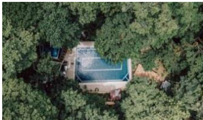
Gambar 8. Kolam Mandala

Wisata Buatan adalah jenis destinasi wisata yang dirancang dan dibangun oleh manusia dengan tujuan untuk menghibur, mendidik, atau memberikan pengalaman rekreasi oleh manusia dengan tujuan untuk menghibur, mendidik, atau memberikan pengalaman rekreasi kepada pengunjung juga sebagai bisnis atau keuntungan ekonomi. Wisata ini berpotensi cukup besar untuk bisa memberikan alternative wisata kepada wisatawan nasional maupun mancanegara. Sehingga, jenis wisata ini tidak pernah dapat dipisahkan dalam bisnis pariwisata (Wahyudin dkk., 2018). Berikut ini Potensi Wisata Buatan yang ada di Desa Bayan :