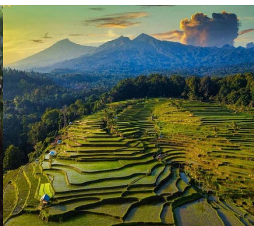
Gambar 2. Area Persawahan Terasering