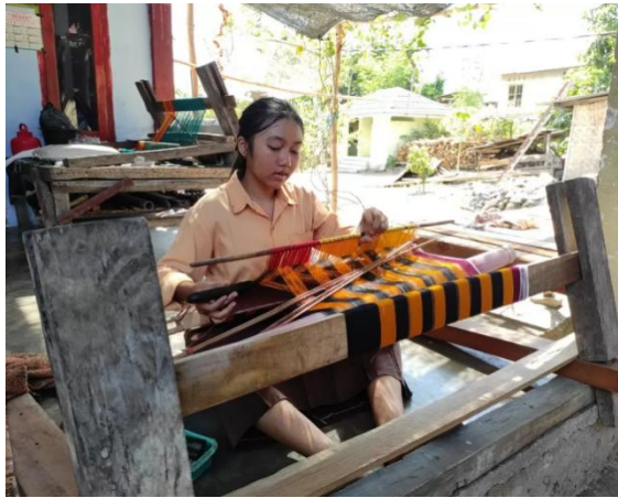
Gambar 6. Kerajinan Tenun