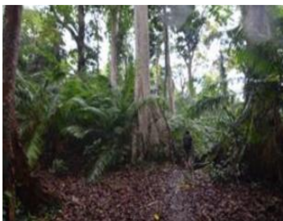
Gambar 1. Hutan Aadat

Wisata alam merupakan jenis pariwisata yang menyajikan keindahan lingkungan alami dan dapat ditemukan di berbagai lokasi, terutama di pedesaan. Alam tetap menjadi pilihan favorit para wisatawan. Sebagai destinasi wisata yang berada di Kabupaten Lombok Utara, Desa Bayan memiliki potensi wisata yang mampu menarik minat pengunjung, khususnya dalam hal keindahan alam. Beberapa daya tarik wisata alam yang dimiliki desa ini antara lain: