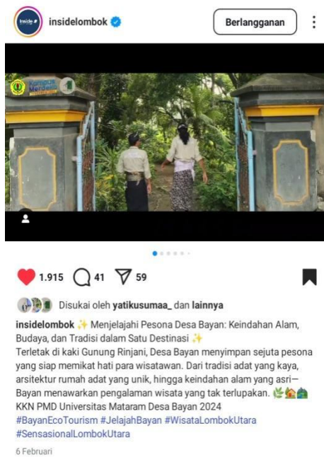
Gambar 9. Publikasi Video Promosi