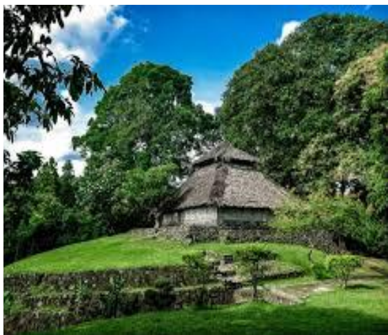
Gambar 4. Masjid Kuno

Wisata budaya merupakan jenis pariwisata yang bertujuan untuk mengenal dan memahami kebudayaan suatu daerah atau negara, baik melalui seni, adat istiadat, tradisi, kuliner, maupun pakaian khas. Selain itu, cakupan wisata budaya kini semakin luas, mencakup pembelajaran tentang kebiasaan serta gaya hidup masyarakat setempat. Hal ini menjadikan wisata budaya sebagai salah satu daya tarik utama yang mampu menarik minat wisatawan untuk berkunjung. Berikut ini berbagai potensi wisata budaya di Desa Bayan :