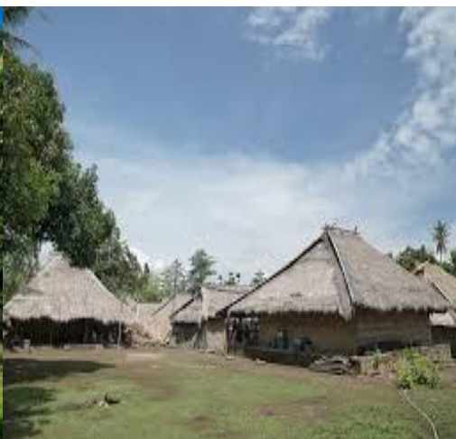
Gambar 5. Rumah Adat