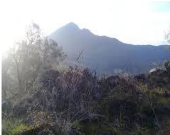
Gambar 3. Bukit Setampol