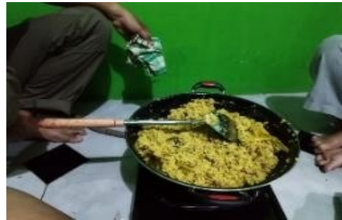
Gambar 5. Daging ikan manyung yang sudah tercampur dengan bumbu