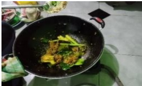
Gambar 3. Bumbu yang sudah dihaluskan kemudian dimasak di api sedang