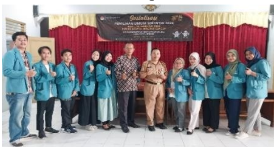
Gambar 8. Penyerahan Booklet Penting Abimanyu

Pelaksanaan Audiensi dan penyerahan Booklet Penting Abimanyu kepada pihak Krlurahan PasarBatang dilaksanakan pada tanggal 29 Agustus 2023 dengan menyampaikan terkait inovasi dalam pembuatan abon Ikan Manyung. Audiensi dilaksanakan bertempat di Aula Kelurahan Pasarbatang dengan mencakup hal-hal yang di sampaikan seperti cara pembuattan Abon Ikan Manyung, manfaat dari Abon Ikan Manyung, tujuan adanya inovsi pembuatan Abon Ikan Manyung serta kandungan gizi yang terdapat dalam Abon Ikan Manyung. Tim KKN-T Kelompok 1 Pasarbatang juga menyerakan booklet Abon Ikan Manyung kepada pihak Kelurahan Pasarbatang dengan tujuan agar