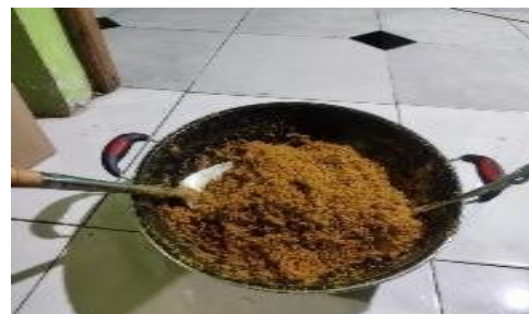
Gambar 6. Proses sangria abon ikan manyung sampai kering

Selanjutnya, setelah tahapan tersebut selesai dilakukan tahapan pengemasan produk ikan manyung dengan memasukan abon ikan manyung yang sudah jadi kedalam wadah serta memberikannya label produk pada bagian luar kemasannya.