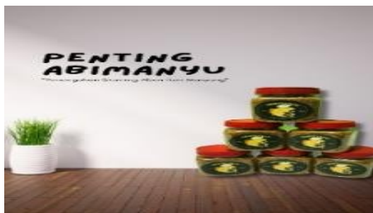
Gambar 7. Produk Abon Ikan Manyung