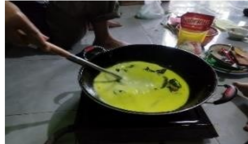
Gambar 4. Proses pencampuran bumbu halus dengan daging ikan manyung