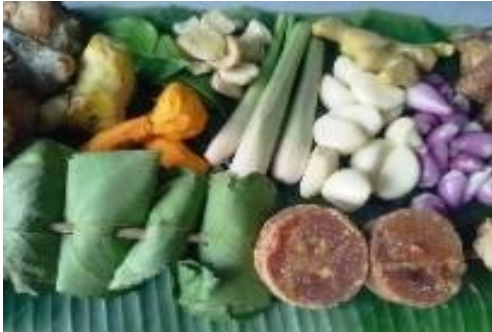
Gambar 1. Penyiapan bahan-bahan untuk abon ikan manyung

Kunyit, Santan kental, Daun salam, Daun jeruk, Lengkuas, Sereh, Garam, Gula merah, Gula pasir, Kaldu bubuk, Ketumbar bubuk, Minyak, Air.