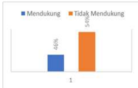
Gambar 2. Hasil Aspek Afektif pada Pernikahan Dini

Berdasarkan gambar 2 aspek afektif lebih dari setengah remaja memiliki aspek afektif tidak mendukung pernikahan dini (54%). Artinya, lebih dari setengah remaja di SMA Nahwa Cantigi sudah memiliki respon emosional yang baik dalam menyikapi pernikahan dini.