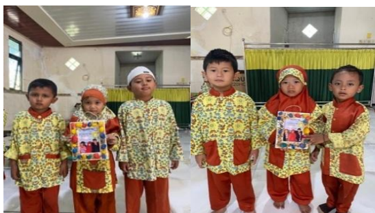
Gambar 7. Hasil Karya TK A

Proses pembuatan pigura tidak hanya melatih kemampuan kognitif dan kreativitas, tetapi juga mengajarkan anak-anak untuk menghargai benda-benda di sekitar mereka dan memahami nilai kearifan lokal budaya Madura. Setiap kelompok menunjukkan keunikan dalam desain dan komposisi hiasan yang dipilih, mencerminkan imajinasi dan kerja sama antar anggota kelompok. Hasil karya ini kemudian dipasangkan dengan foto anak-anak yang telah dicetak oleh lembaga sebagai kenang-kenangan yang bermakna.