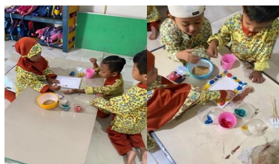
Gambar 3. Kegiatan Kemampuan Berpikir Logis Anak Kelompok A

sesekali masih memerlukan konfirmasi dari guru. Sebanyak 2 anak telah mencapai kategori Berkembang Sangat Baik (BSB), di mana mereka mampu mengurutkan kerang secara mandiri dan konsisten, bahkan dapat melakukannya dengan urutan terbalik (dari besar ke kecil) tanpa kesulitan. Sementara itu, 2 anak lainnya masih berada pada kategori Mulai Berkembang (MB), yang belum mampu mengurutkan kerang dari kecil ke besar secara konsisten dan masih memerlukan bimbingan intensif dari guru untuk memahami konsep urutan seriasi.