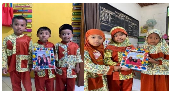
Gambar 8. Hasil Karya TK B

Anak-anak kelompok A menunjukkan hasil karya pigura foto yang telah mereka buat bersama dengan kelompok masing-masing disertai foto yang telah dicetak oleh lembaga