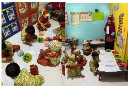
Gambar 4. Kegiatan Kemampuan Berpikir Logis Kelompok B

telah dibuat. Sementara itu, 2 anak masih berada pada kategori Mulai Berkembang (MB), yang masih memerlukan contoh konkret dan arahan langsung dari guru untuk memahami konsep pola empat unsur, serta kesulitan dalam mengingat urutan dan mengulangi pola secara konsisten.