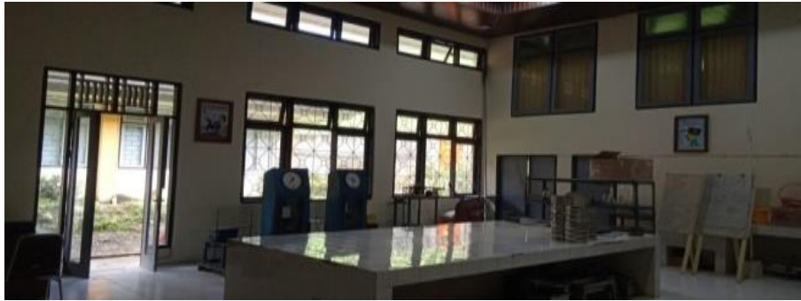
Gambar 3. Lokasi Penelitian