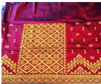
Gambar 02 Kain Songket Motif Wajik Bintang, Foto: Sukma Afifa 2022

Motif lainnya yang cukup banyak dibuatkan berberapa macam variasi yaitu motif wajik, motif ini bersumber ide dari makanan atau jajanan yang berbentuk petak. Motif wajik memiliki cukup banyak variasi diantara wajik bunga tampuk, wajik bunga kecupu, wajik bintang, dan wajik petak.