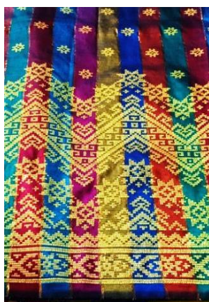
Gambar 03 Kain Songket Motif Siku Keluang, Foto: Sukma Afifa 2022

Selanjutnya juga terdapat motif siku, motif siku ini memiliki cukup banyak seperti motif siku bintang, motif siku bersumber ide dari bentuk segitiga siku-siku yang dikombinasikan dengan relung-relung dan lainnya.