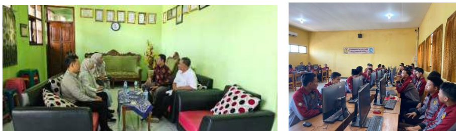
Gambar 1. Analisa Situasi Mitra dan Penyamaan Persepsi Tujuan PKM

Berdasarkan hasil capaian rapor pendidikan tahun 2024 pada jenjang SMK di Kabupaten Mojokerto memberikan penjelasan bahwa kemitraan dan keselarasan SMK dengan dunia kerja masuk dalam kategori sedang yaitu SMK diharapkan mampu menyelaraskan kualitas pembelajaran, tata kelola, dan kompetensi SDM dengan standar dan kebutuhan dunia kerja (Kemendikdasmen, 2024)(Subrianto et al., 2024)(All, 2022). Rekomendasi dari rapor bahwa peningkatan dapat dilakukan melalui keterlibatan mitra dunia kerja dalam merancang dan mengelola pembelajaran SMK (Sasongko et al., 2025)(Dlauissama et al., 2025). Mitra dalam PKM ini yaitu murid SMKN 1 Kemlagi Kabupaten Mojokerto kelas XI. Pada analisis situasi awal (gambar 1) bersama Kepala Sekolah, Ketua Jurusan DPIB, dan Waka Kurikulum menyampaikan bahwa adanya ketidakmampuan siswa untuk memahami standar gambar teknik, arti, tujuan, dan contoh teknologi BIM, serta cara menggambar proyeksi ortogonal (2D) dan proyeksi piktorial (3D) menggunakan aplikasi perangkat lunak Revit, yang berfungsi sebagai dasar untuk pemodelan dan desain informasi bangunan.