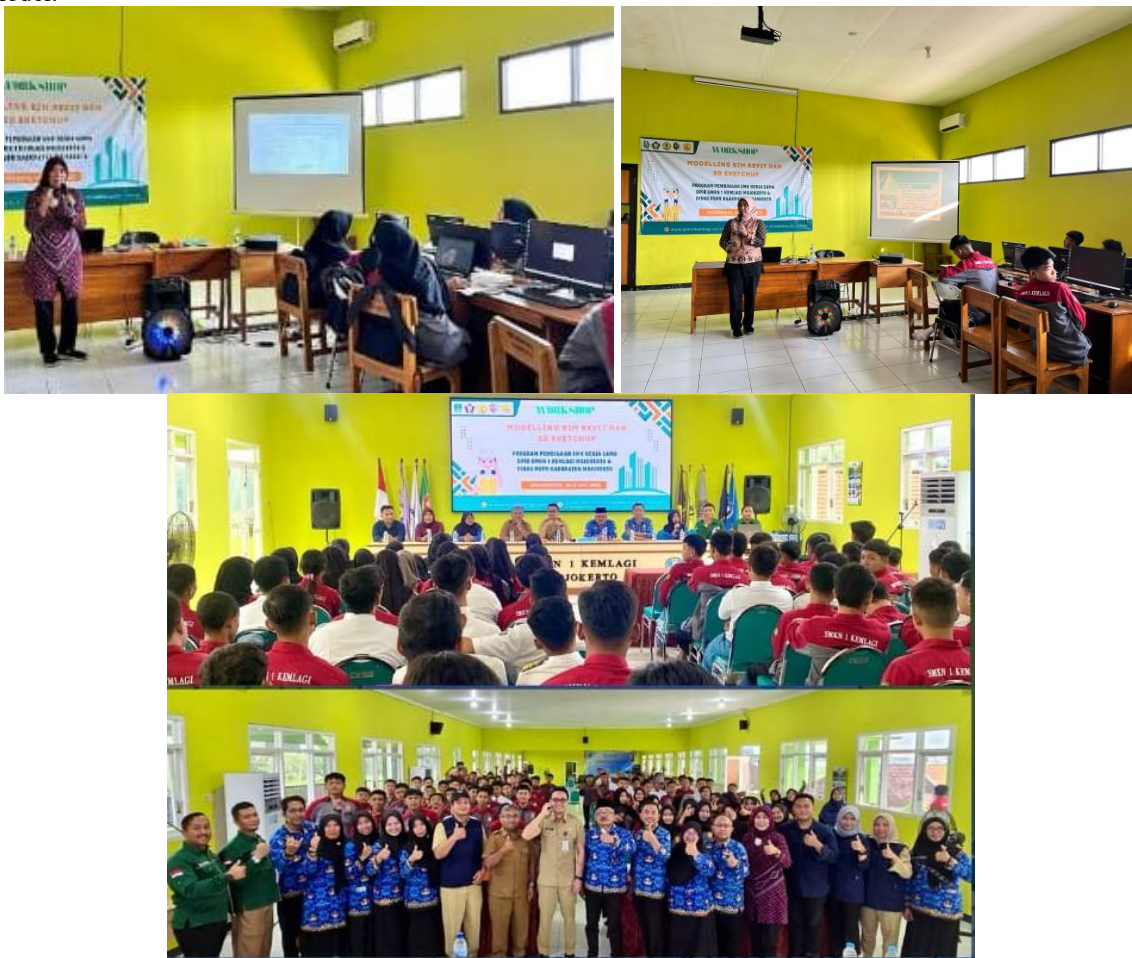
Gambar 3. Pelaksanaan Kegiatan PKM

Pada tahapan pelaksanaan pelatihan dilakukan asesmen awal untuk mengetahui kompetensi peserta didik sebelum mengikuti pembelajaran. Asesmen ini dipergunakan untuk menjadi dasar pemetaan kemampuan siswa yang memerlukan bimbingan dan yang sudah cakap/mahir. Pada sesi hari pertama dengan diikuti oleh murid DPIB 1 (34 siswa), DPIB 2 (36 siswa), dan DPIB 3 (36 siswa) materi yang diberikan meliputi dasar-dasar pengenalan BIM Revit dan sesi hari kedua merupakan lanjutan ke kompetensi 3D model.