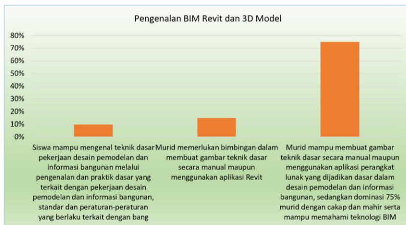
Gambar 5. Hasil asesmen formatif dan sumatif

Lebih dari 10% mahasiswa mampu mengidentifikasi metode dasar pemodelan dan perancangan informasi bangunan melalui pengenalan dan praktik dasar terkait pemodelan dan perancangan informasi bangunan, standar, dan regulasi yang berlaku pada bangunan, berdasarkan hasil penilaian formatif dan sumatif. Sebanyak 15% mahasiswa memerlukan bantuan dalam membuat gambar teknik dasar secara manual atau menggunakan aplikasi Revit, sementara mayoritas mahasiswa \geq 75\% mampu memahami teknologi BIM dan membuat gambar teknik dasar secara kompeten dan mahir. (Gambar 5).