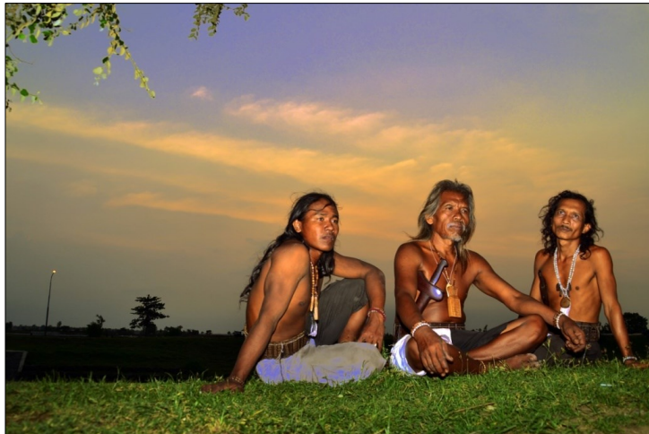
Gambar 1. Suku Dayak Bumi Segandu Losarang (Dokumentasi: Agung Trihadono Putra, 2018)

Menurut Sumardjo spritual adalah sesuatu yang berhubungan dengan keseluruhan yang lebih luas, lebih dalam, dan lebih kaya yang meletakkan situasi terbatas kita saat ini saat ini dalam perspektif baru. Dengan demikian, spritual berhubungan dengan sesuatu yang transenden, sesuatu yang transenden adalah yang melampaui, menembus, mengatasi, semua apa yang telah kita alami dan ketahui dalam hidup ini. Jadi spritual adalah “yang diluar sana”, “yang berbeda”, bukan ini dan itu”. Spritual tidak terbatas dengan demikian “tidak ada” dalam pengalaman dan pengetahuan kita, tapi justru :ada: yang sejati dalam logika, serta pengalaman. (20006: 12).