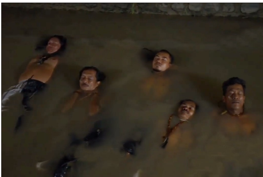
Gambar 4. Kumkum

dengan menggunakan bahasa Jawa Indramayu (2012: 123-124). Usai kidung mereka beranjak ke sungai kecil di dekat perkampungan mereka, kemudian merendamkan diri hingga esok pagi Mereka tetap dengan tidak menggunakan baju atasan, selama 8 jam mereka harus menahan dingin dan juga gigitan ikan-ikan kecil yang usil di dalam sungai kecil tersebut.