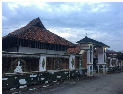
Gambar 2. Bagian Depan Pintu Masuk Pesanggrahan Suku Dayak Bumi Segandu Losarang (Dokumentasi : Agung Trihandono Putra; 2018)

Meski sejatinya suku Dayak Indramayu juga hidup dan berkembang berdekatan dengan masyarakat sekitar, namun untuk beberapa hal sepertinya mereka lebih memilih untuk tertutup atau mengasingkan diri dari pengaruh luar dan sekitarnya. Bisa kita saksikan, jika kita mencermati bentuk bangunan yang digunakan sebagai tempat ibadah mereka yang dikelilingi oleh benteng serta ornamen lukisan termasuk bahkan untuk tempat tinggal mereka sendiri.