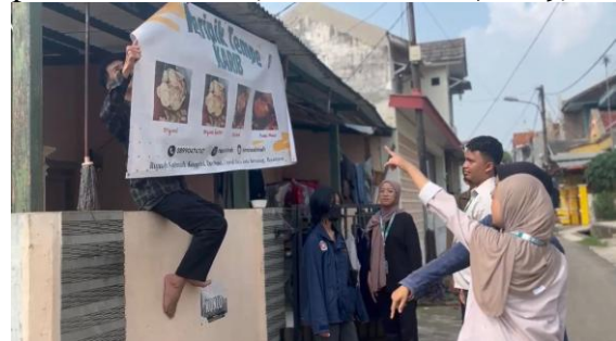
Gambar 2. Spanduk Promosi

Spanduk promosi dipasang di depan rumah produksi dan titik strategis sekitar. Bahasa promosi dirancang ringkas namun informatif, sesuai dengan prinsip komunikasi visual yang efektif dalam promosi UMKM (Amelia & Fitria, 2019).