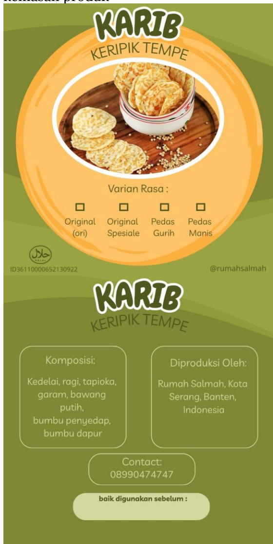
Gambar 1. Stiker kemasan Tempe Karib

Desain stiker yang dibuat mencerminkan identitas lokal, dengan warna cerah dan logo sederhana. Informasi penting seperti komposisi, tanggal kedaluwarsa, izin PIRT, dan logo halal dicantumkan secara jelas. Hal ini sesuai dengan temuan Prameswari & Rukmana (2020) yang menyatakan bahwa desain kemasan yang informatif dan menarik dapat meningkatkan minat beli konsumen secara signifikan. Desain stiker yang dibuat ditempelkan pada setiap kemasan produk