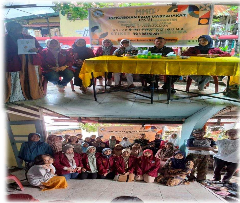
Gambar 1. Dokumentasi Kegiatan pengabdian Kepada Masyarakat

Data yang diperoleh dari 17 responden wanita menopause menunjukkan adanya perubahan signifikan dalam tingkat pemahaman setelah mengikuti kegiatan edukasi yang dilaksanakan oleh tim pengabdian. Sebelum kegiatan dilakukan, seluruh responden (100%) berada pada kondisi "Tidak Mengerti" terkait isu kesehatan reproduksi pada masa menopause. Ini mencerminkan adanya kesenjangan pengetahuan yang cukup besar di komunitas tersebut, khususnya pada kelompok usia lanjut. Ketidaktahuan ini kemungkinan besar disebabkan oleh belum adanya akses pada informasi kesehatan yang relevan dan dapat dipahami, serta rendahnya intensitas kegiatan penyuluhan yang menjangkau kelompok wanita menopause.