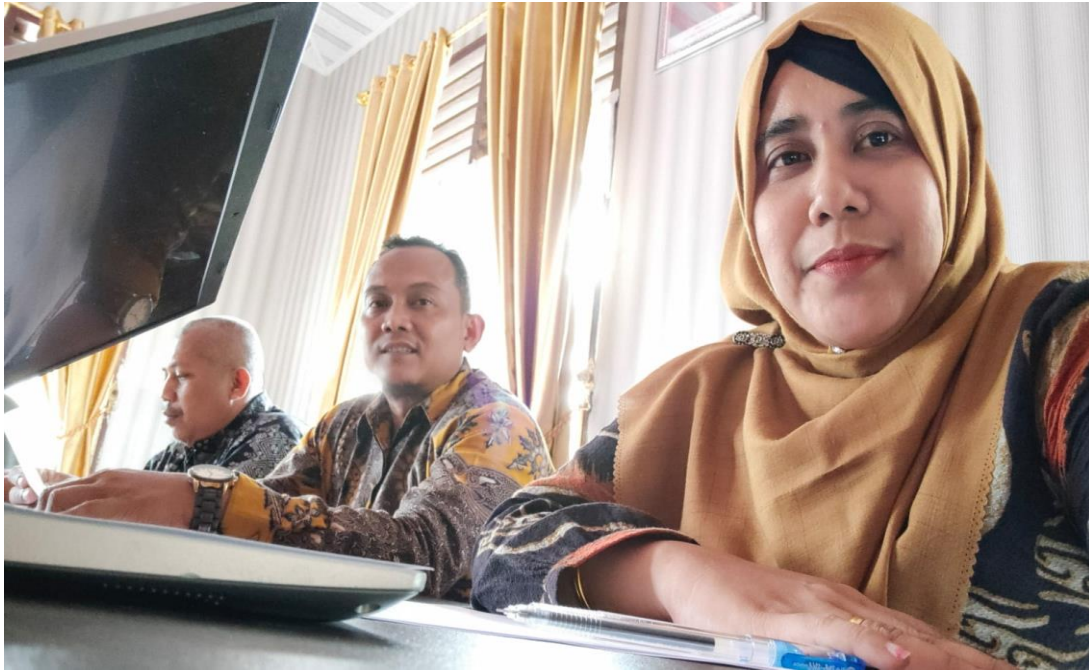
Gambar 1. Tim Penguji Perangkat Desa dari LPPM Universitas Pasir Pengaraian