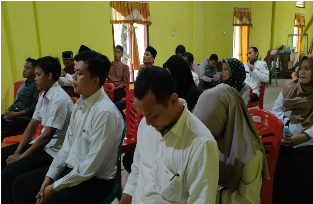
Gambar 3. Peserta Tes Perangkat Desa Pekan Tebih