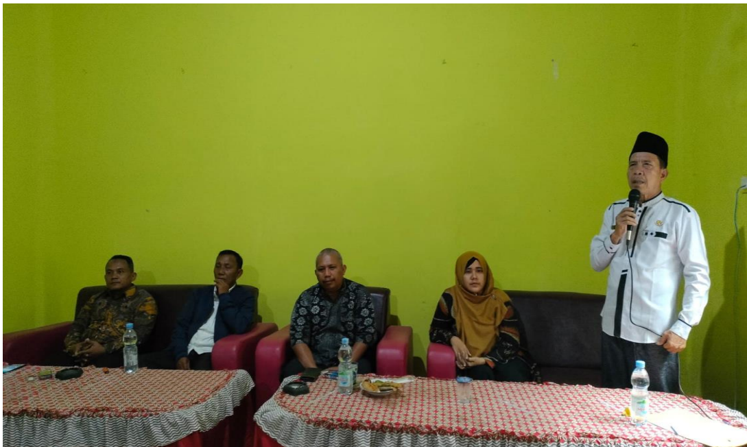
Gambar 2. Sambutan Kepala Desa Pekan Tebih pada Acara Pembukaan