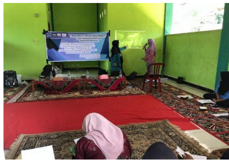
Gambar 2. Implementasi Pembelajaran Inovatif Melibatkan Porang Tua

Difusi ipteks dilakukan melalui pengembangan dan produksi media pembelajaran inovatif yang disesuaikan dengan konteks budaya lokal. Produk yang dihasilkan meliputi kartu cerita rakyat bergambar dari berbagai etnis, papan permainan tradisional adaptif, lembar kerja tematik terintegrasi, serta buku panduan praktis bagi guru dan orang tua. Proses pengembangan media melibatkan guru dan orang tua dalam tahap desain, uji coba, dan revisi untuk memastikan relevansi, kemudahan penggunaan, dan keberterimaan budaya.