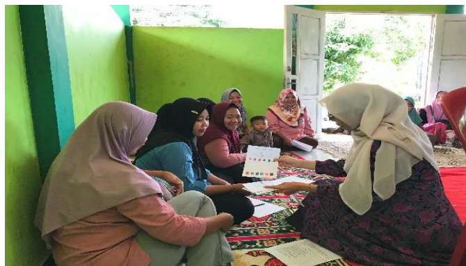
Gambar 7. Difusi ipteks Melalui Media Flash Card Multikultural .