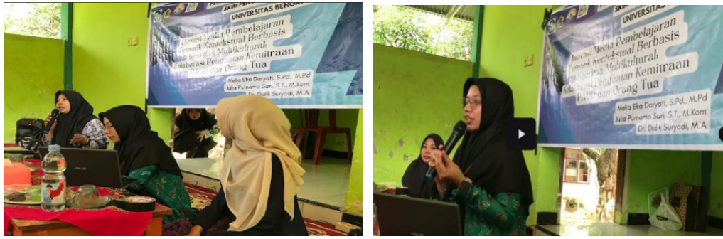
Gambar 1. Proses Penyuluhan