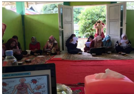
Gambar 4. Proses Evaluasi Program Kegiatan Pengabdian

Evaluasi program dilakukan secara formatif dan sumatif dengan menggunakan instrumen yang telah divalidasi. Data dikumpulkan melalui pre-test dan post-test pemahaman peserta, observasi praktik pembelajaran, wawancara mendalam, serta analisis dokumentasi portofolio anak. Keberhasilan program diukur berdasarkan indikator peningkatan kompetensi guru dalam merancang pembelajaran tematik, tingkat partisipasi orang tua, serta kualitas interaksi pembelajaran yang mencerminkan nilai-nilai multikultural.