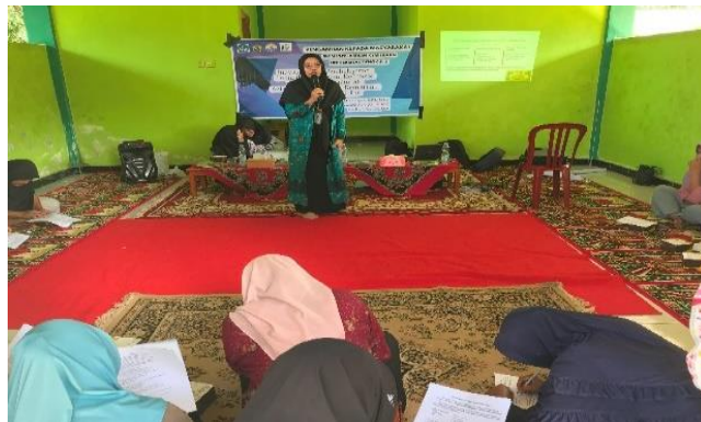
Gambar 6. Pendidikan melalui Penyuluhan inovasi media tematik

Pelaksanaan kegiatan ini menunjukkan peningkatan yang signifikan dalam pemahaman guru dan orang tua tentang pembelajaran berbasis multikultural. Melalui penyuluhan, 87% peserta menyatakan bahwa mereka memahami konsep dan pentingnya integrasi nilai budaya dalam pembelajaran anak usia dini. Selain itu, pelatihan ini berhasil menghasilkan berbagai media pembelajaran sederhana dan inovatif, seperti kartu cerita rakyat, papan permainan tradisional, dan lembar kerja berbasis budaya lokal.