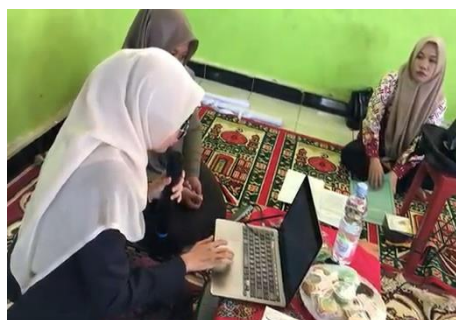
Gambar 3. Pendampingan Kegiatan Pengabdian

Pendampingan berkelanjutan dilakukan melalui kunjungan berkala ke lembaga PAUD mitra untuk memfasilitasi implementasi media pembelajaran dan memberikan umpan balik konstruktif. Tim pengabdian juga membentuk kelompok kerja guru-orang tua sebagai wadah berbagi pengalaman dan pemecahan masalah secara kolaboratif. Monitoring dilakukan menggunakan lembar observasi pembelajaran, dokumentasi kegiatan, dan focus group discussion (FGD) untuk mengevaluasi efektivitas program dan mengidentifikasi area perbaikan.