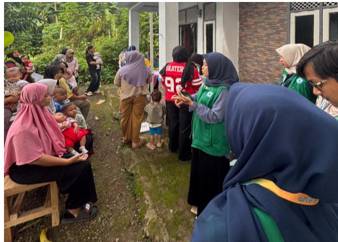
Gambar 3. Proses Penyuluhan