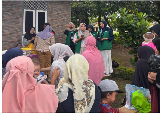
Gambar 2. Proses Persiapan Dilakukan Pre-Test dan Post-Test