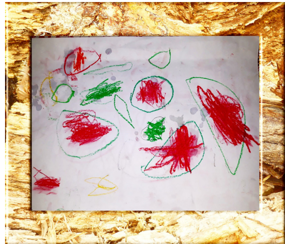
Gambar 1. Keluarga Tuak (Telor) Karya Reivan Arkan (Dokumentasi: Syarifah Nur Hajja, Oktober 2020)

Seperti karya yang dihasilkan oleh anak-anak Taman Pendidikan Al-Quran An-Nawawi yang memiliki hasil karya yang beragam. Hasil gambar yang dihasilkan oleh anak-anak terlihat murni, ekspresif, dan polos belum tersentuh oleh teknik dan pengetahuan dari guru seni budaya atau dari guru les/kursus/private. Berikut ini adalah uraian gambar karya anak-anak TPA An-Nawawi Cikeusal dan uraian penjelasan makna visual gambar menggunakan teori Iconology dari Erwin Panofsky (1972: 5-14):