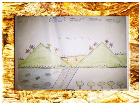
Gambar 5. Matahari Terbit Karya Siti Nurlela (Dokumentasi: Syarifah Nur Hajja, Oktober 2020)

Gambar karya Rangga usianya 9 tahun menggambarkan tentang suasana di area perkampungan, dari pewarnaan gunung yang berwarna biru menunjukkan lokasi gunung yang jauh dan terlihat indah. Matahari terbit dengan cerah di antara pengunungan. Dua rumah yang kokoh dan besar berada bersebrangan yang dibatasi oleh jalan raya. Memberikan penafsiran bahwa lahan ini adalah lahan bersih yang dihuni oleh dua rumah besar yang megah.