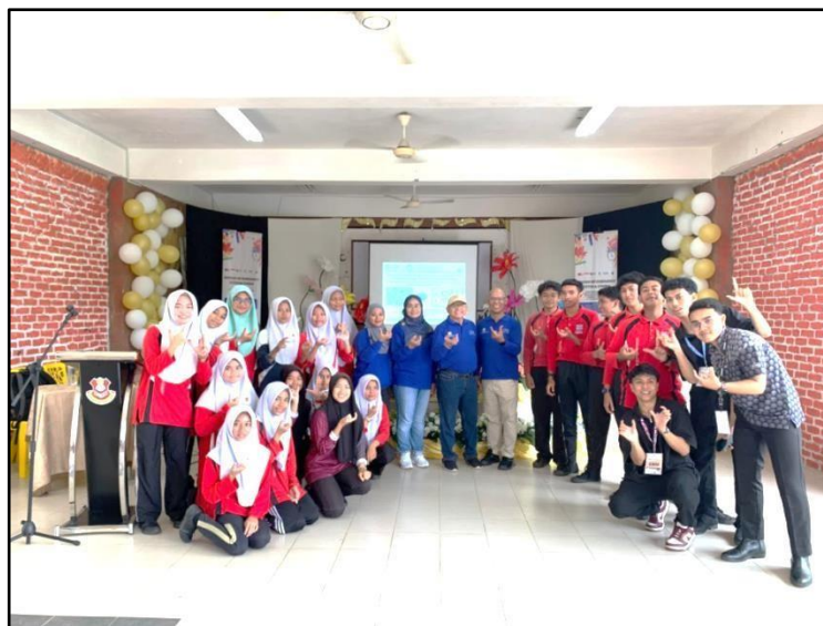
Gambar 4. Foto Bersama Peserta