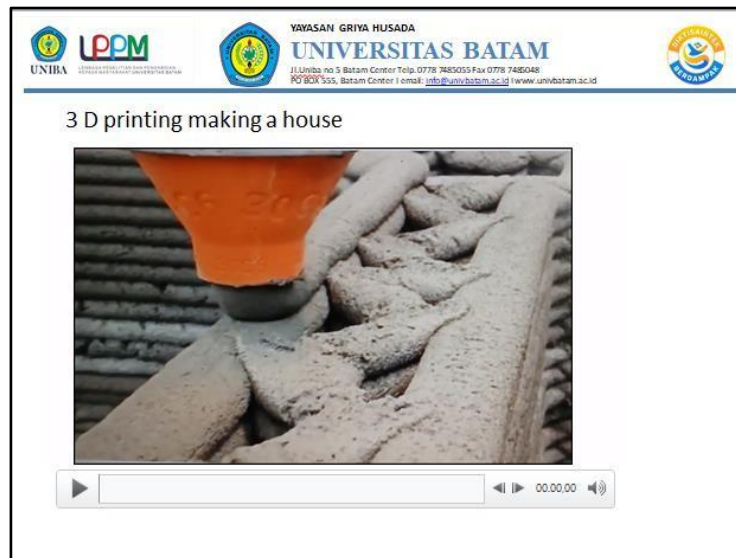
Gambar 7. Video Edukasi