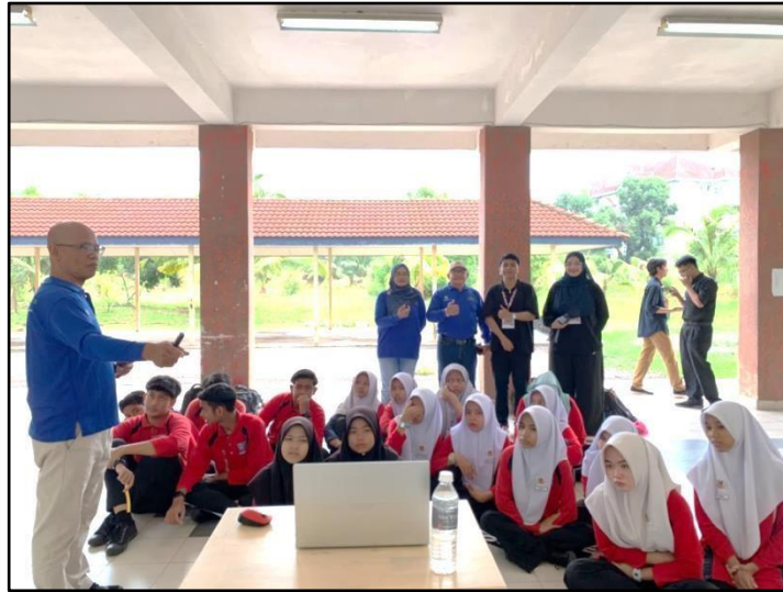
Gambar 3. Pelaksanaan Kegiatan