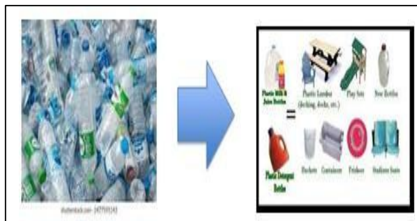
Gambar 5. Bekas Botol PET dan Sampah Plastik