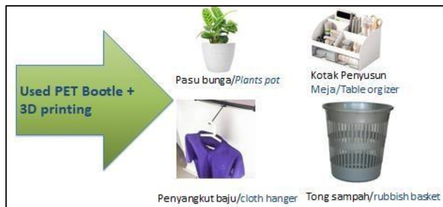
Gambar 8. Hasil Kerajinan dari Sampah Plastik