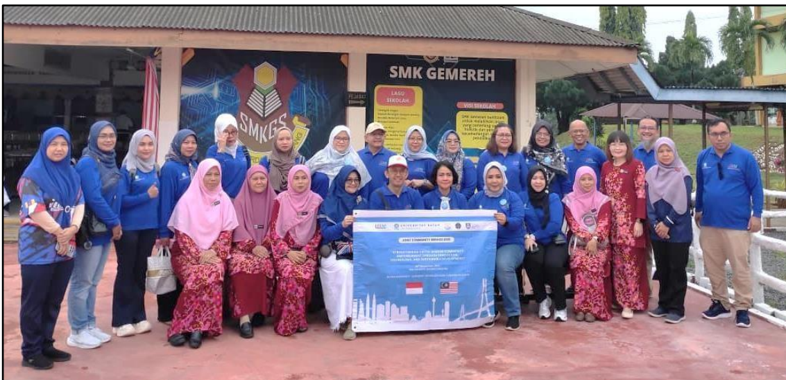
Gambar 1. Lokasi Pengabdian

Beberapa dokumentasi gambar dan foto di lokasi pengabdian SMK Gemereh Segamat, Malaysia berikut ini: