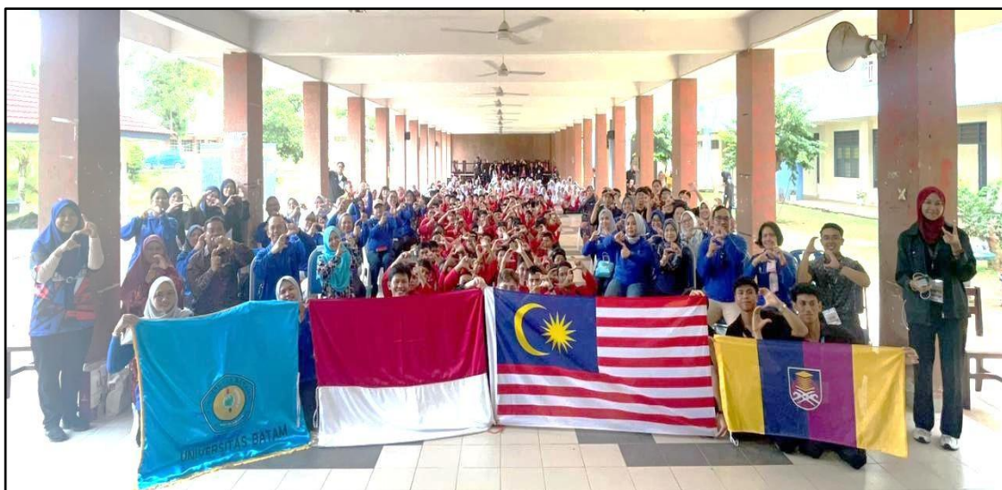
Gambar 2. Foto Bersama Pengabdian