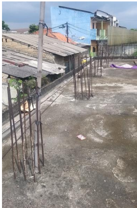
Gambar 1. Kondisi Salah Satu Bangunan yang sudah Terpasang Tulangan

Setelah survei selesai dilakukan, tim pengabdian kembali ke lokasi pengabdian untuk mengumpulkan data yang diperlukan dalam pelaksanaan pekerjaan kolom. Data yang dikumpulkan terdiri dari wujud komitmen tim mitra pengabdian, dokumentasi kondisi lapangan, kondisi demografis bangunan terbengkalai, dan tinjauan akses angkut barang menuju lokasi. Jenis tulangan untuk kolom diteliti untuk disesuaikan dengan dukungan sumber daya yang ada di program studi D3 Konstruksi Gedung Politeknik Negeri Jakarta. Selanjutnya, data kemudian disesuaikan dengan peraturan SNI terkait untuk perumusan metode pelaksanaan yang tepat (SNI 1727:2013, 2013; SNI 2847:2019, 2019). Salah satu hasil dokumentasi kondisi lapangan dapat dilihat pada Gambar 1.