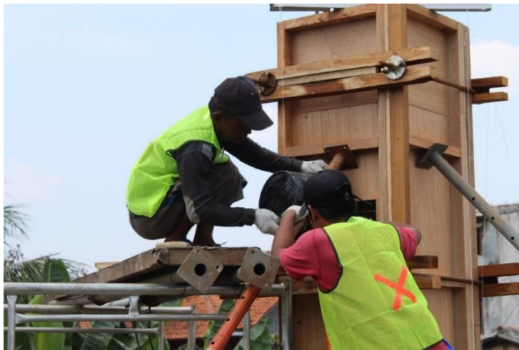
Gambar 2. Situasi saat Pelaksanaan Kegiatan Konstruksi Pembangunan Kolom

Seluruh kegiatan pekerjaan kolom bangunan lantai 2 Pondok Pesantren Ashhaburratib dilakukan dengan metode pengerjaan struktur kolom sesuai Standar Nasional Indonesia (SNI) terbaru (SNI 1727:2013, 2013; SNI 2847:2019, 2019) yang ditunjukkan pada Gambar 2. Manajemen konstruksi diaplikasikan sejak pada tahap perencanaan sampai pada tahap pelaksanaan pekerjaan konstruksi yang ditunjukkan pada Gambar 3. Pengaplikasian ini dilakukan bertujuan untuk mendapatkan hasil optimal dengan tetap memperhatikan batasan waktu, biaya dan mutu (Stefanus, 2020). Hasil pelaksanaan kolom gedung juga untuk menjaga tulangan yang sebelumnya sudah dipasang tidak semakin lama terpapar oleh lingkungan luar yang dapat menimbulkan korosi dan mempengaruhi kekuatan dari kolom tersebut (Amalia et al., 2022).