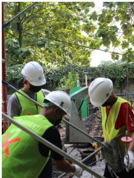
Gambar 3. Keterlibatan Mitra dalam Kegiatan Pengabdian kepada Masyarakat