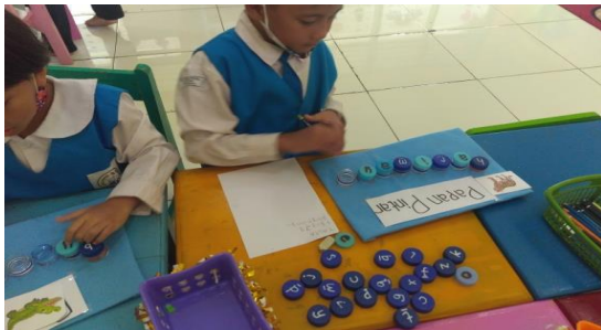
Gambar 5. Kegiatan Anak Bermain Papan Pintar Pada Siklus 2

Setelah melakukan aktivitas kegiatan, anak-anak bebas memilih permainan apa yang ingin dimainkan lebih dulu sesuai aturan yang sudah disepakati di awal. Ketika permainan yang digunakan sudah penuh semua, anak-anak dipersilakan untuk bermain bebas di area pojok bermain, sambil menunggu ada tempat yang kosong. Pada saat bermain papan pintar, anak-anak diminta untuk menemukan huruf apa saja yang dibutuhkan untuk menyusun nama gambar yang sudah disediakan oleh guru sambil menyebutkannya kemudian mencatatnya di lembar kosong yang sudah disediakan oleh guru. Setelah anak menyelesaikan tugas yang diberikan guru, di akhir kegiatan inti, guru memberikan reward bintang sebagai ucapan terima kasih kepada anak karena telah menyelesaikan tugas yang diberikan guru dengan baik.