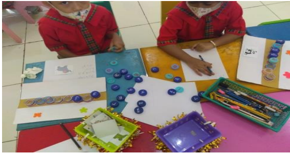
Gambar 3. Kegiatan Anak Bermain Papan Pintar Pada Siklus 1