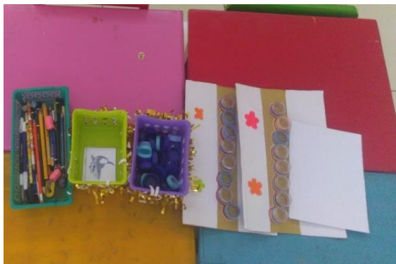
Gambar 2. Media Papan Pintar Siklus 1

Media papan pintar yang digunakan pada siklus 1 masih berupa papan kertas duplet yang dihias sedemikian rupa dengan leher botol yang melekat pada papan, dan menyediakan tutup botol yang ditulisi dengan huruf abjad dari huruf a-z. Berikut tampilan dari media papan pintar yang peneliti gunakan pada siklus 1.