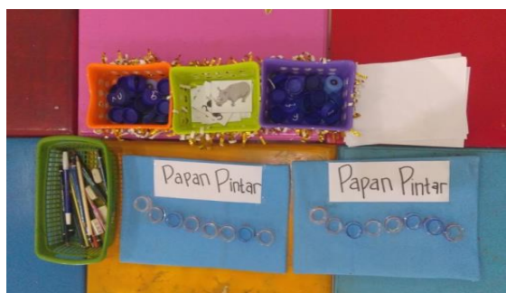
Gambar 4. Media Papan Pintar Siklus 2