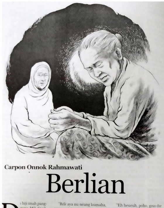
Gambar 4. Ilustrasi Agus Mulyana

Mulyana pada cerpen Berlian karya Onok rahmawati di majalah Mangle No. 2268, 22-28 April 2010 halaman 20 di bawah ini gaya nya realis karena bentuk sama dengan bentuk realita yang sesungguhnya.