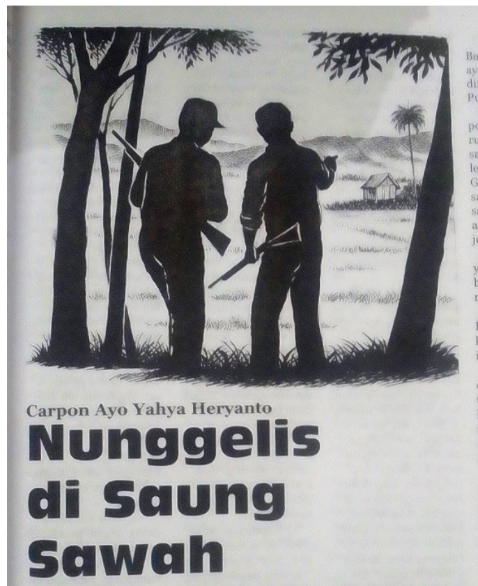
Gambar 1. Ilustrasi Agus Mulyana (Dokumentasi: Mangle no 2265, 1-7 april 2010 halaman 23)

Metode analisis yang digunakan adalah pendekatan analisis deskriptif. Metode analisis deskriptif adalah salah satu jenis metode penelitian yang berusaha menggambarkan dan menginterpretasi objek