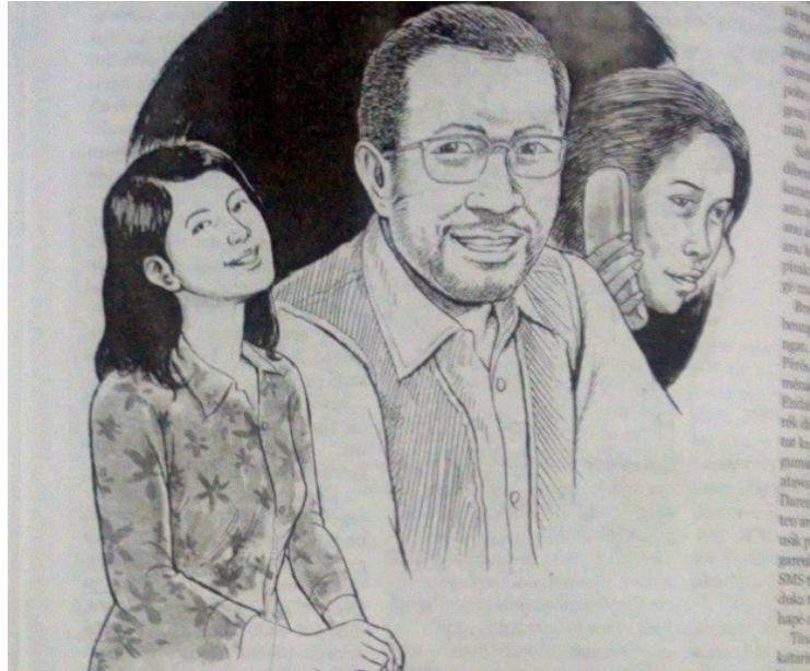
Gambar 5. Ilustrasi Agus Mulyana (Dokumentasi: Mangle No. 2266 halaman 28, Tgl 8-14 April 2020)

Penokohan-penokohan karakter dalam cerita ini biasanya adalah warga masyarakat biasa di dalam kesehariannya dengan permasalahan yang berbeda dalam setiap cerita pendek yang berlainan pula. Skenario naskah cerpen dari pengarang yang berbeda-beda, namun untuk Ilustrator tetap Agus Mulyana.