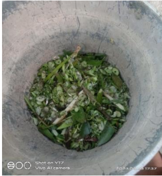
Gambar 4.1 Hasil Cacahan Eceng Gondok

Pada rangka mesin pencacah eceng gondok di fokuskan pembebanan pada rangka mesin dengan menerima beban terpusat yang hanya ada pada motor penggerak yang tersambung pada baut pengunci yang mempunyai beban 8kg atau 80 N simulasi pembebanan rangka ditunjukkan pada Gambar 4.2 sebagai berikut: